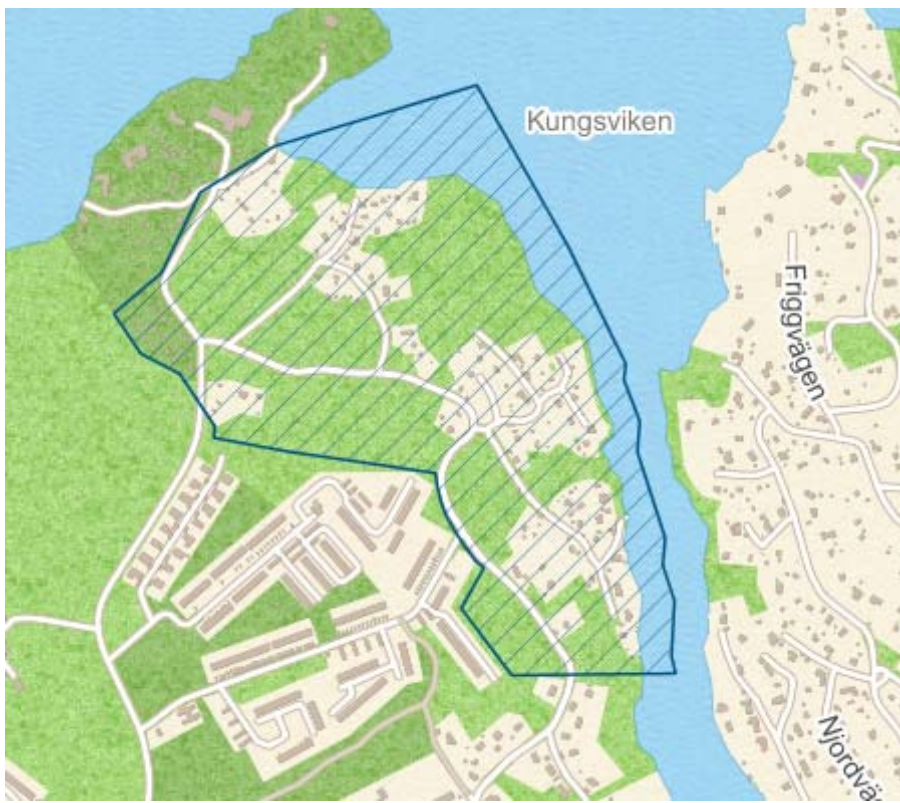
Projektet Norra Skurus avgränsning markerat med randig yta