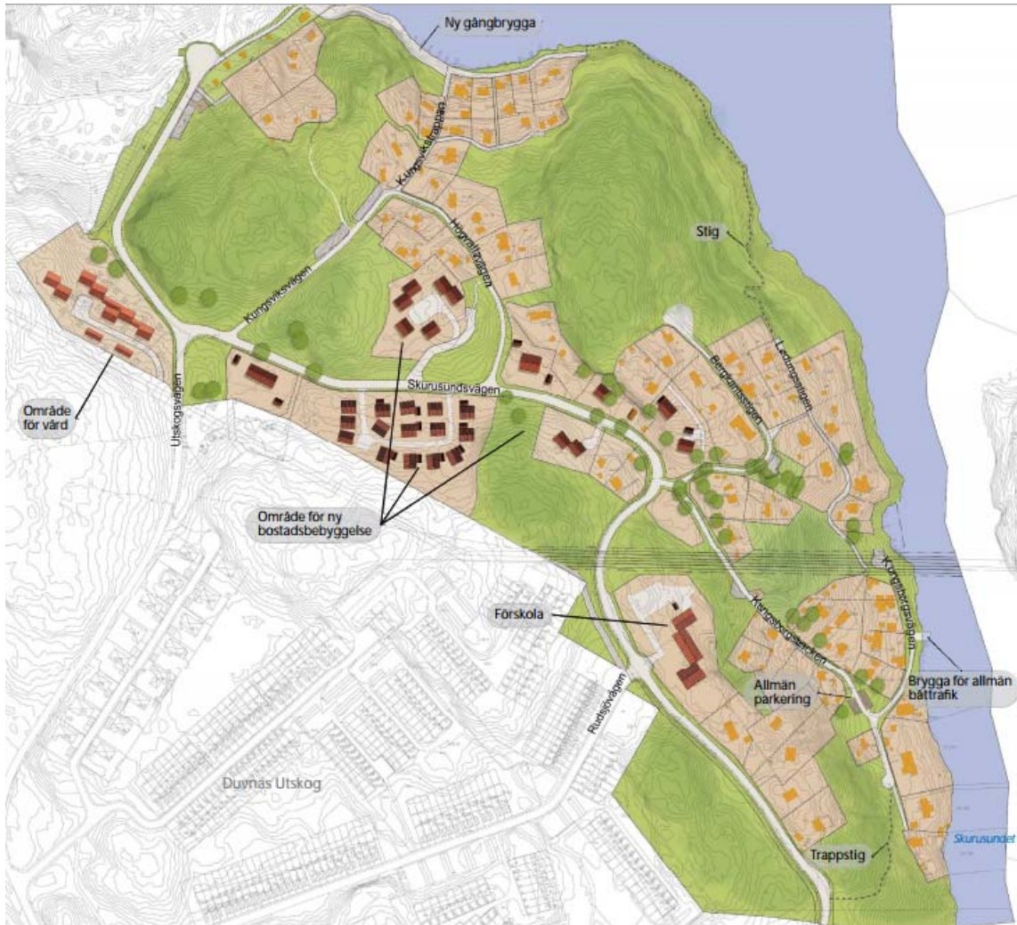
Illustrationsplan för Norra Skuru