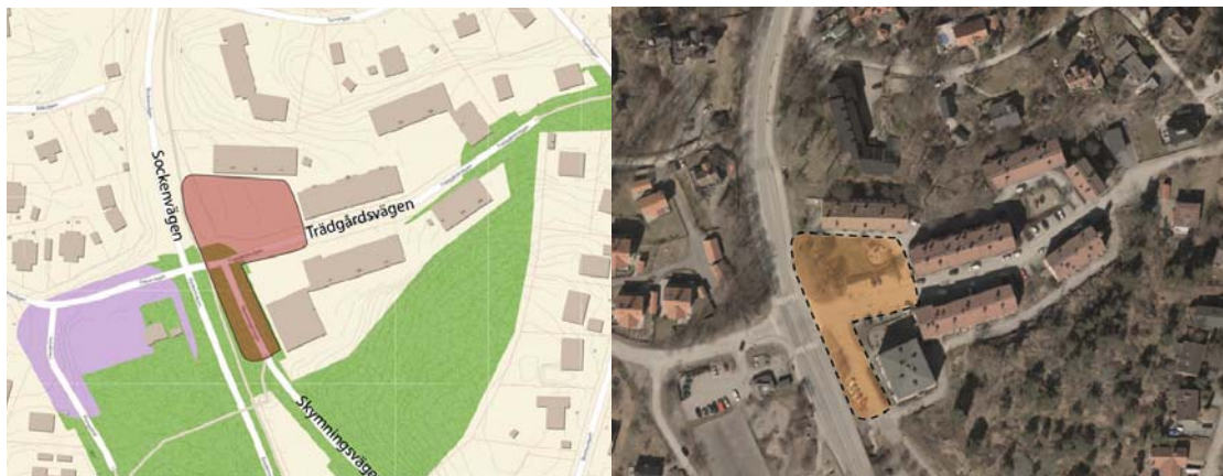
Detaljplanens preliminära avgränsning.