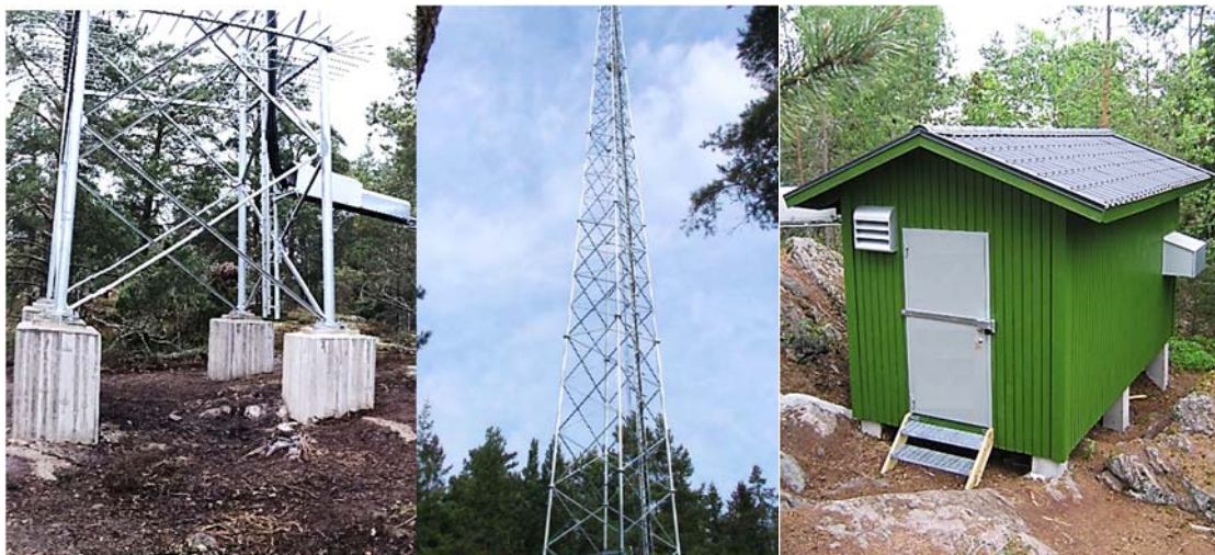
Bild till vänster visar exempel på mastfundament. Bild i mitten visar mobilmast i den masttyp som avses att uppföras. Bild till höger visar utformning av teknikbodarna som verksamhetsutövaren avser att uppföra.

Mobilmasten ska hindermarkeras enligt Transportstyrelsens föreskrifter och allmänna råd TSFS 2010:155 (ändrad genom TSFS 2013:9).