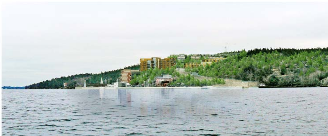
Illustration av ny bebyggelse från sydväst

För att exploatören ska kunna söka vattendom krävs att de har rådighet över marken där vattenverksamheten ska ske. Kommunen kommer att ge exploatören rådighet över allmän plats på de delar längs med vattnet som exploatören ska bygga. Ett fastighetsbildningsbeslut om marköverföring från externa fastighetsägare till kommunal allmän plats är därför ett viktigt led för att projektet ska kunna komma vidare och vattendom kunna sökas.