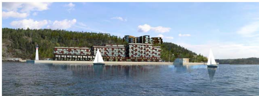
Illustration av ny bebyggelse från norr