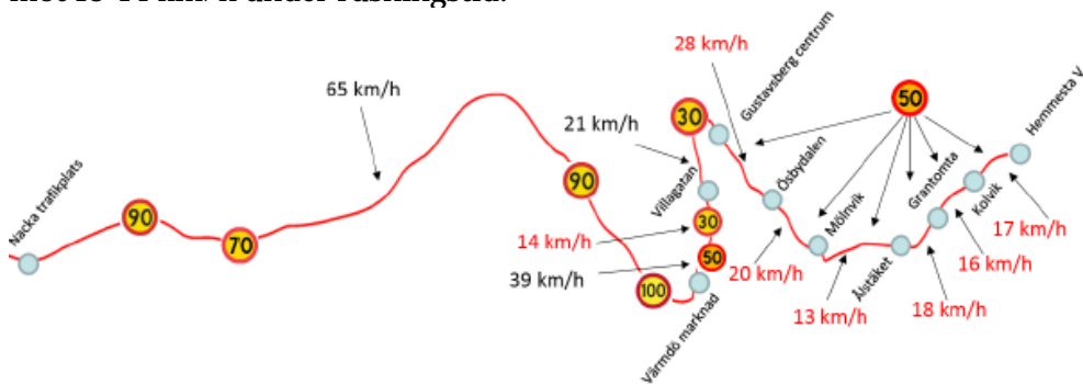
Figuren visar skyltade hastigheter och genomsnittshastigheter längs sträckan Hemmesta vägskäl - Nacka trafikplats under morgonens högtrafik. Hastigheter i rött innebär ej uppnådd målhastighet.

Stomnässtråket mellan Nacka trafikplats och Hemmesta vägskäl har stort resande med buss och vissa framkomlighetsproblem men också en potential till betydande restidsförkortningar. Längs flera sträckor når bussen inte upp i den målstandard om minsta medelhastighet som tagits fram inom ramen för ÅVS:en (se även tabell 1 i bilagan). Längs vissa sträckor i Gustavsberg samt mellan Mölnvik och Hemmesta vägskäl är den genomsnittliga hastigheten för bussarna mycket låg, ner mot 13-14 km/h under rusningstid.