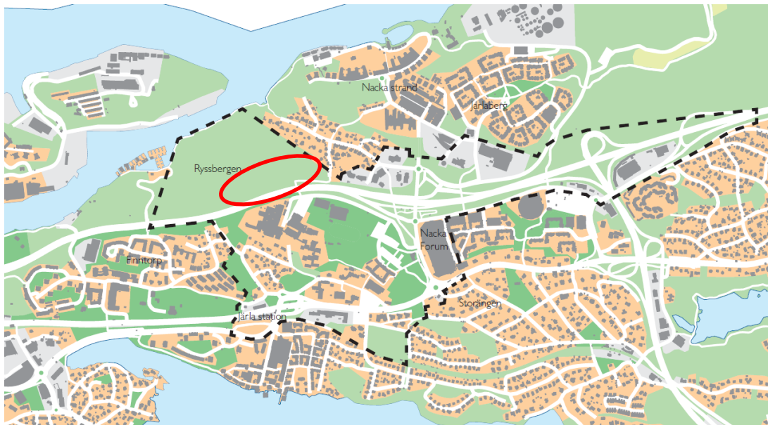
Detaljplaneområdets ungefärliga läge

Projektet ska ta fram en- eller två detaljplan/er och pröva möjligheterna för totalt cirka 40 000 m 2 BTA nya bostäder både öster och väster om tunnelmynningen till Kvarnholmsförbindelsen, en förskola i bostadsbebyggelsen och ca 8 000-12 000 m 2 verksamheter, i huvudsak längs med väg 222 Värmdöleden.