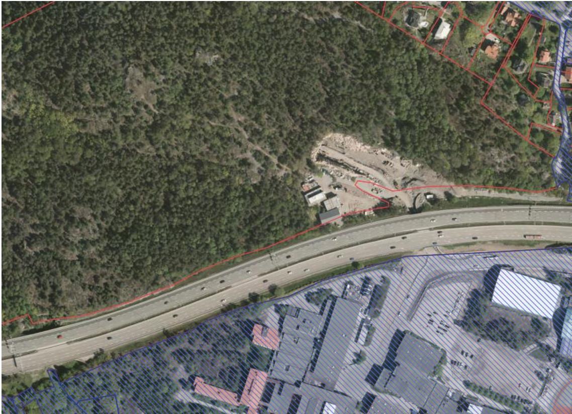
Kommunägd mark är markerad med skrafferad blå färg. Övrig mark är privatägd.

Ett detaljplaneprogram har tagits fram för centrala Nacka och antogs av Kommunstyrelsen i 13 april 2015. Syftet med detaljplaneprogrammet är att skapa en levande och attraktiv stadskärna i Nackas centrala delar. Arbetet utgår från visionen ”nära och nyskapande”. Planprogrammet är också en del i genomförandet av översiktsplanens strategi ”en tätare och mer blandad stad på västra Sicklaön”. Det tar ett helhetsgrepp för den framtida stadsutvecklingen och underlättar för kommande detaljplaner. Vid antagandebeslutet delegerades starten av de ingående stadsbyggnadsprojekten till planchefen och exploateringschefen.