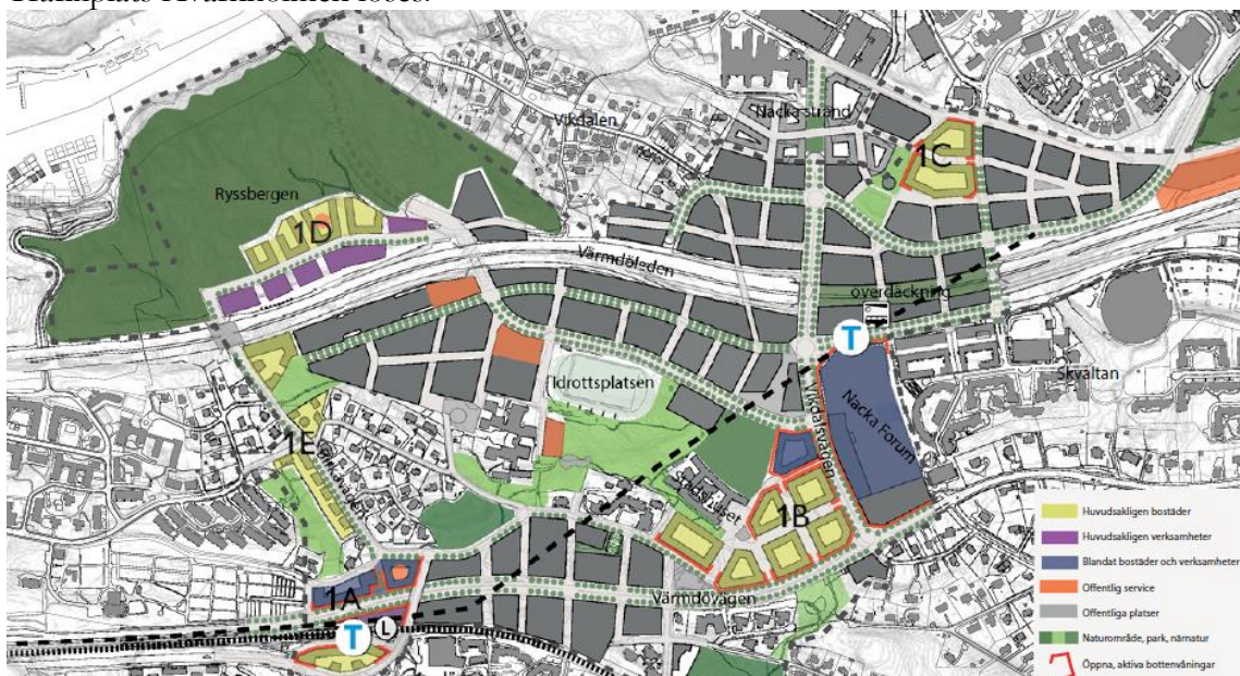
Programförslaget för Centrala Nacka.

De nya bebyggelseområdena i detaljplaneprogrammet, som ingår i projektet är i etapp 1 respektive en mindre del med två kvarter öster om Kvarnholmsförbindelsen i etapp 3, se kartan nedan. Etapp 1 bedöms vara färdigställt till år 2020 och etapp 3 bedöms vara färdigställt till år 2030. Eventuellt kan även kvarteren öster om Kvarnholmsförbindelsen vara aktuella i ett tidigt skede, men utformningen av dessa kommer att vara beroende av hur Trafikplats Kvarnholmen löses.