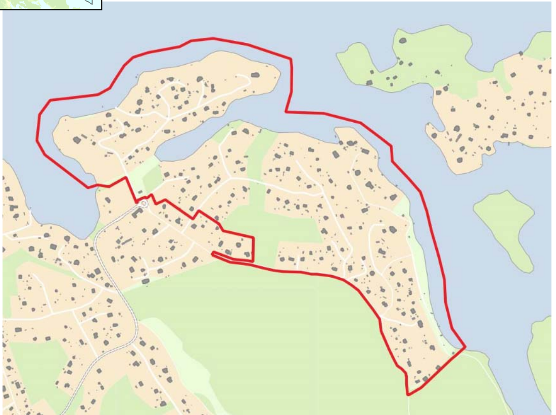
Kartor, planområdets läge i norra Boo, respektive planområdets avgränsning