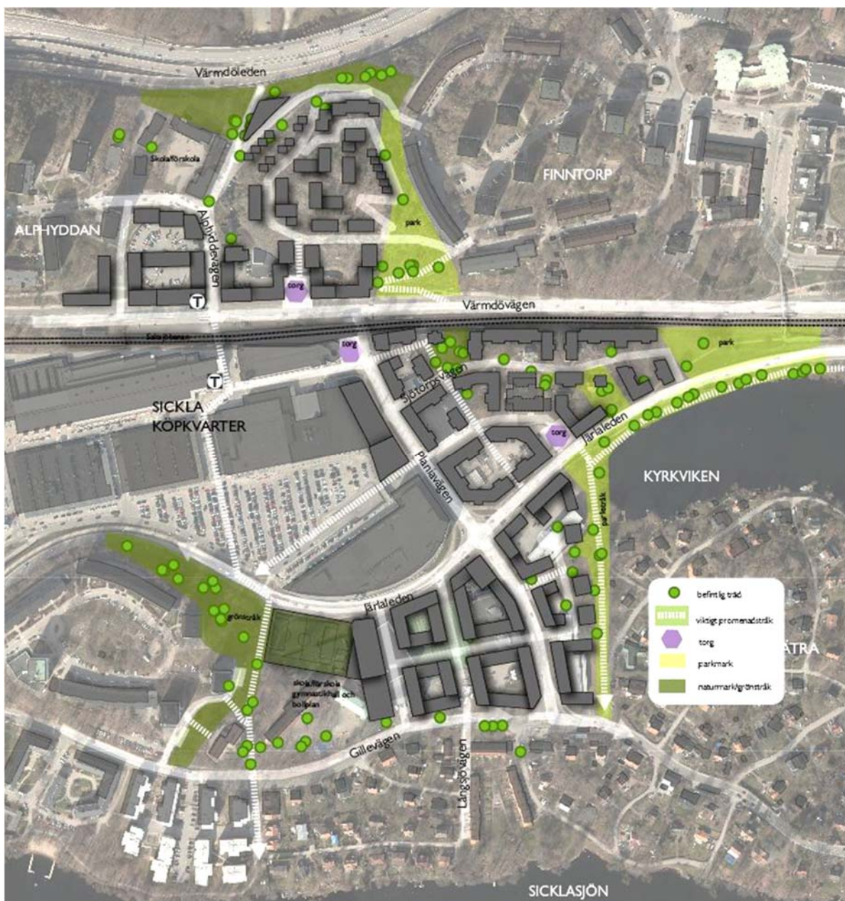
Bilden visar programförslaget