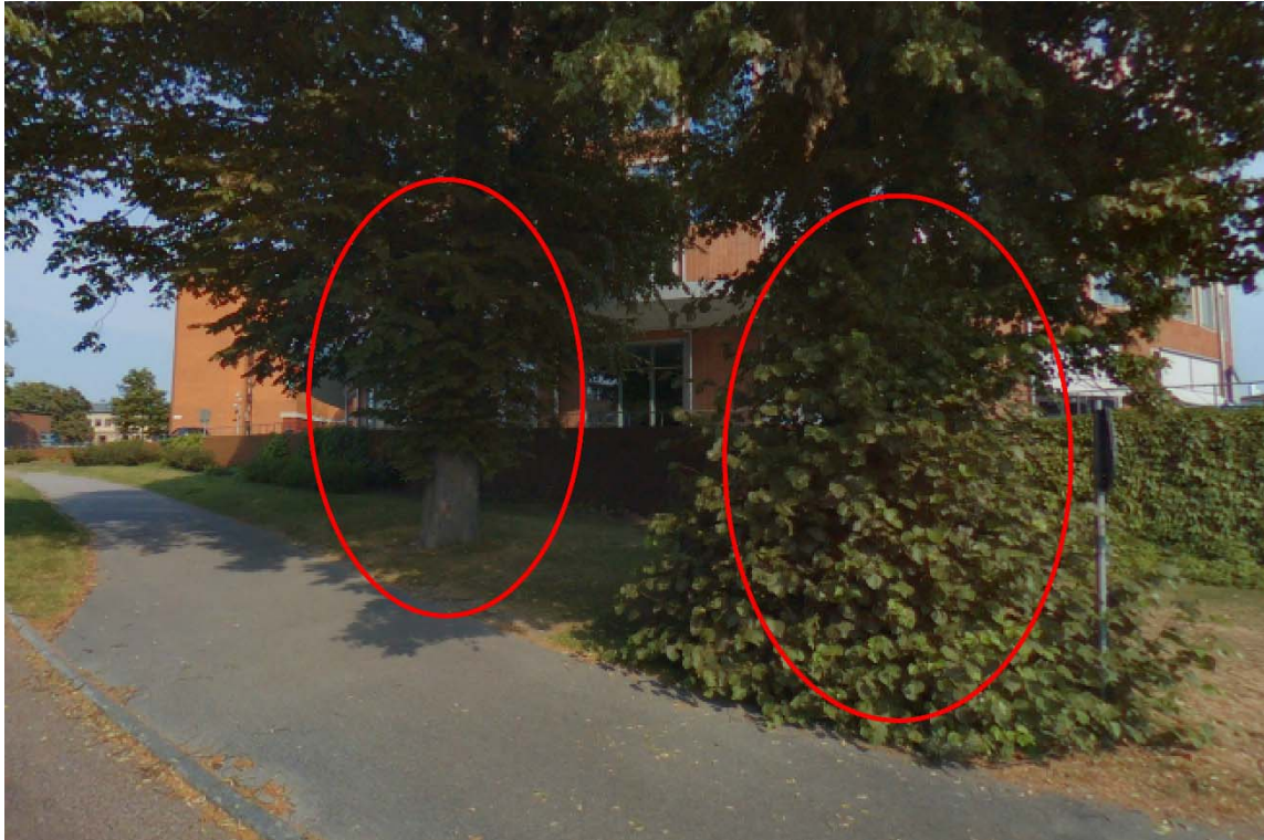
Bild 2: 2 st befintliga träd (Lind) som skall rivas och ersättas med nya träd.

Nya träd skall planteras enligt principer som finns beskrivna i Nacka kommuns tekniska handbok.