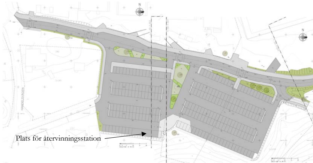
Översiktlig plan parkering.