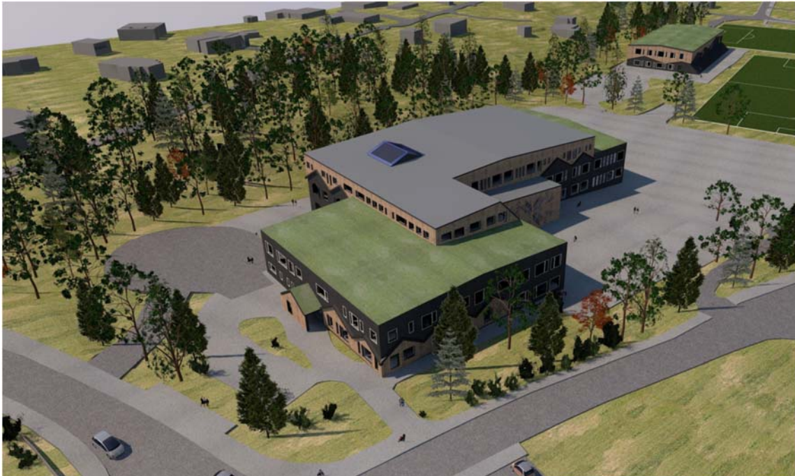
Översiktsbild planerad skola, från sydväst. Bild: Scharc Arkitekter 2017

Skolans lokalyta kommer att kunna utökas väsentligt gentemot de lokaler Boo gårds skola har idag. För att inte den nya skolan skall kännas för stor föreslås att volymen bryts ned i flera volymer och skalan tas ytterligare ned genom ett varierat fasaduttryck inspirerat av Boo Gård och den omgivande villabebyggelsen. Illustrationerna visar en möjlig utformning av skolan och sporthallen.