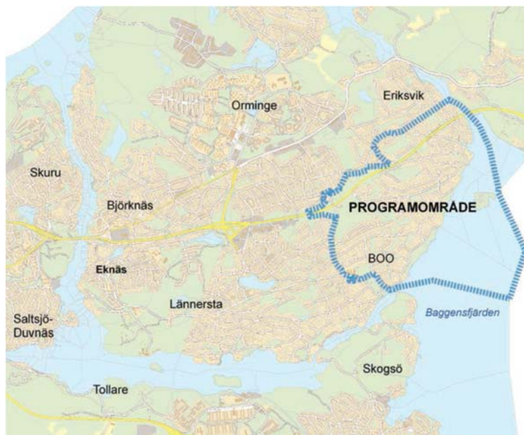
Programområdets omfattning, ur ”Program för sydöstra Boo”, Nacka kommun 2012

Detaljplaneförslaget stämmer överens med riktlinjerna i programmet.