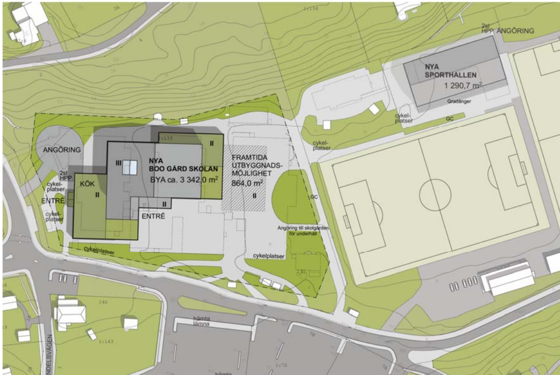
Situationsplan skola. Bild: Scharc Arkitekter 2017