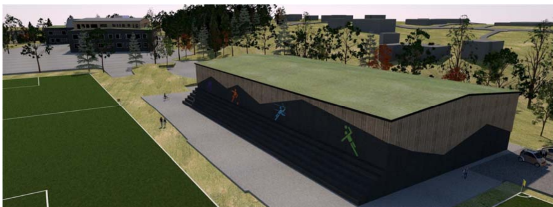
Översiktspild sporthall, från öster. Bild: Scharc Arkitekter 2017

Lokalprogrammet som kommunen tagit fram har prövat olika lägen för en ny sporthall. I diskussion med verksamheten, kommunen och Boo FF:s styrelse har en placering norr om Boovallen valts. På så vis behöver Boovallens bollplaner ej läggas om och idrottsverksamheten kan därför fortgå även under byggtiden. Byggnaden bör kunna fungera som en ljudbarriär för några av villorna norr om Boovallen. Sporthallens långsida mot Boovallen utformas som sittläktare. Sporthallen föreslås kläs i trä- eller stålpanel. Särskild omsorg bör ägnas sporthallens norra fasad, då denna ligger nära granntomten och kan uppfattas som visuellt störande. För att mjuka upp fasaden föreslås därför att fasaden planteras med klätterväxter.