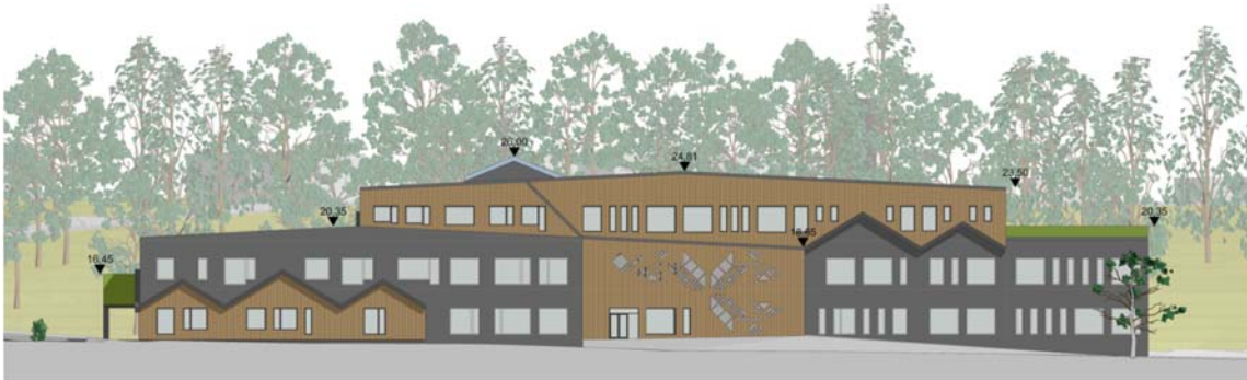
Fasad mot söder, med höjder. Bild: Scharc Arkitekter 2017

Skolans lokalyta kommer att kunna utökas väsentligt gentemot de lokaler Boo gårds skola har idag. För att inte den nya skolan skall kännas för stor föreslås att volymen bryts ned i flera volymer och skalan tas ytterligare ned genom ett varierat fasaduttryck inspirerat av Boo Gård och den omgivande villabebyggelsen. Illustrationerna visar en möjlig utformning av skolan och sporthallen.