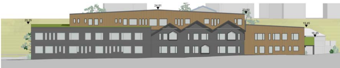
Fasad mot norr, med höjder. Bild: Scharc Arkitekter 2017