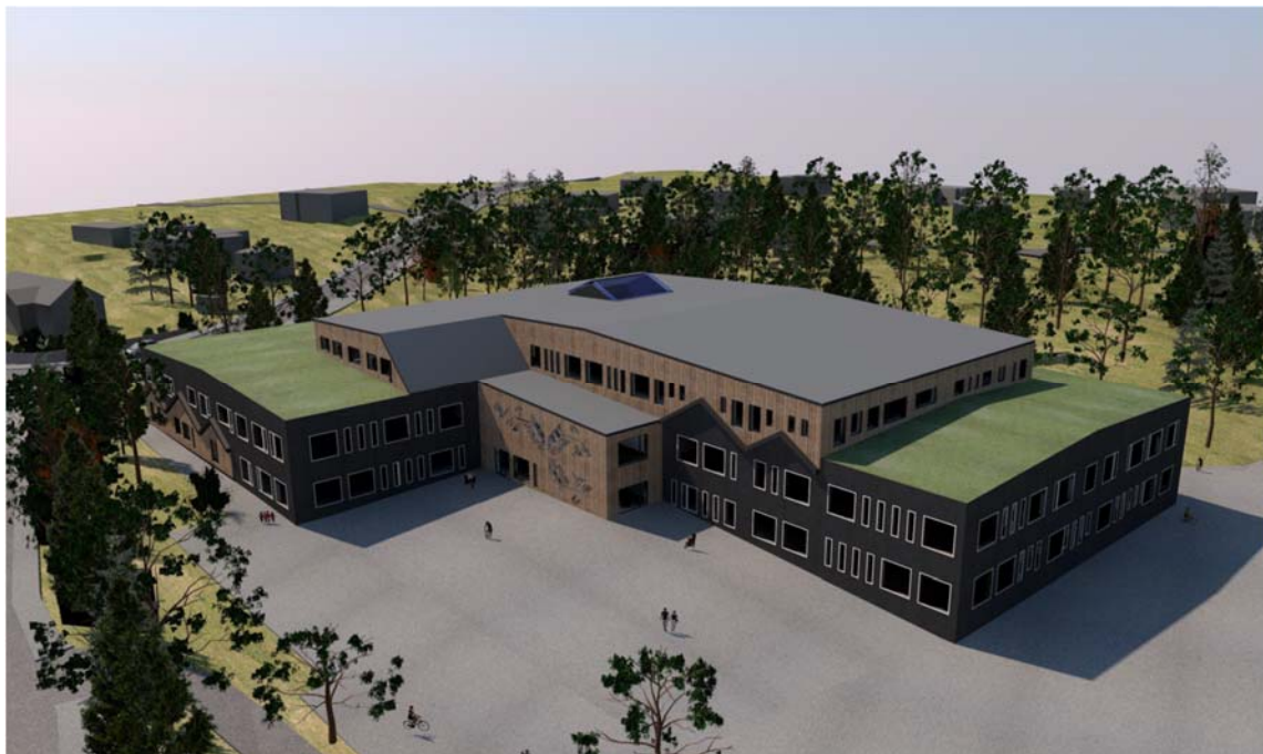
Översiktsbild planerad skola, från sydost. Bild: Scharc Arkitekter 2017