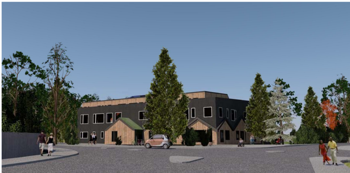
Perspektiv från Boovägen. Bild: Scharc Arkitekter 2017

De högre delarna av skolan föreslås utföras med träfasader. Delar av taken föreslås vara växtklädda med exempelvis sedumväxter, ”gröna tak”. Gröna tak har de fördelarna att de hjälper till att fördröja regnvatten samt att de ser vackra ut. Huvudentrén mot skolgården skall vara tydlig och välkomnande med stora ljusinsläpp. De mindre entréerna ska också vara tydligt markerade.