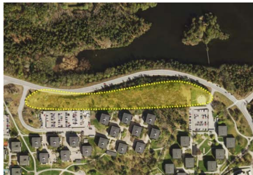
Område 22 Söder om Skarpövägen.