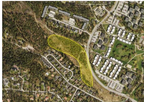
Område 4 Skurusundsvägen, Kungsborgsbacken. Område 18-19 Väster om Ormingeringen.