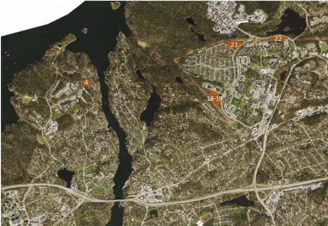
Övergripande bild över exploiterbara områden längs kraftledningsgatan. Område 3 utgår.

Föreslagna områden för detaljplanläggning (gulmarkerade ytor):