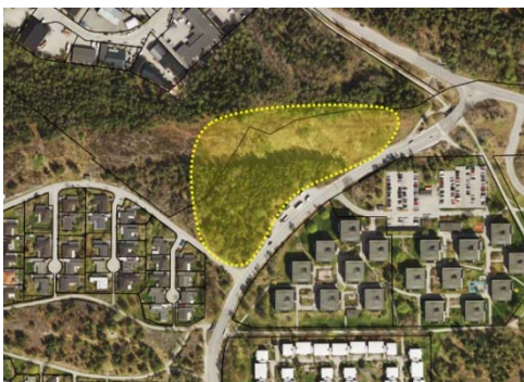
Område 21 Norr om Valvägen.