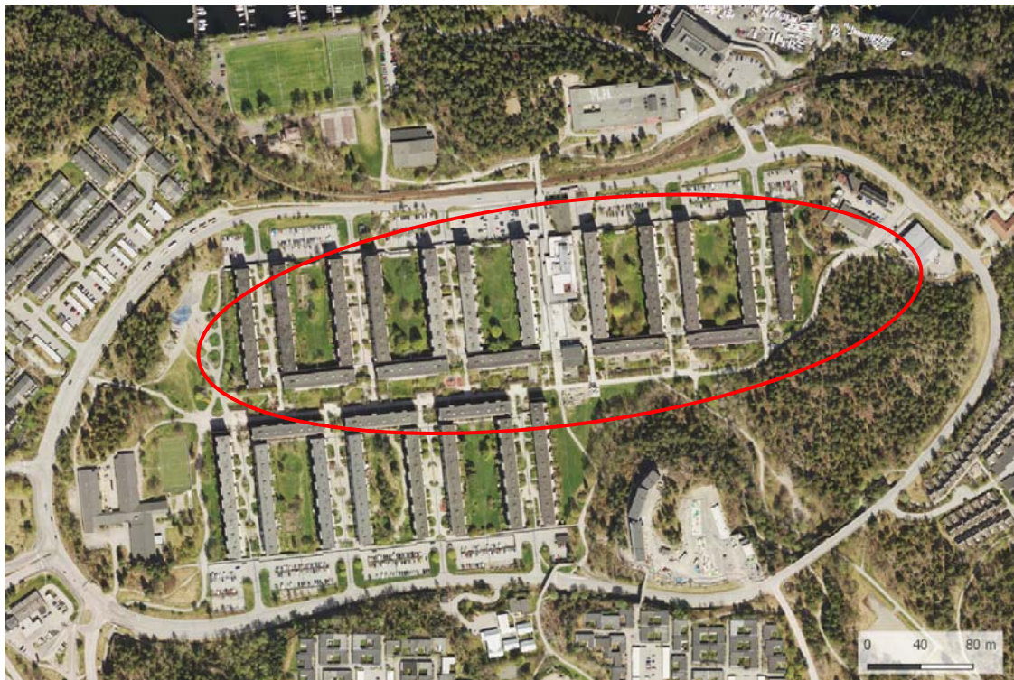
Ortofoto över centrala Fisksätra. Projektets ungefärliga avgränsning i rött.

Planområdet omfattar preliminärt befintliga parkeringsytor, centrumanläggningen och delar av befintliga gårdar. I hur stor omfattning gårdarna kommer att omfattas av planen ska utredas under planarbetet.