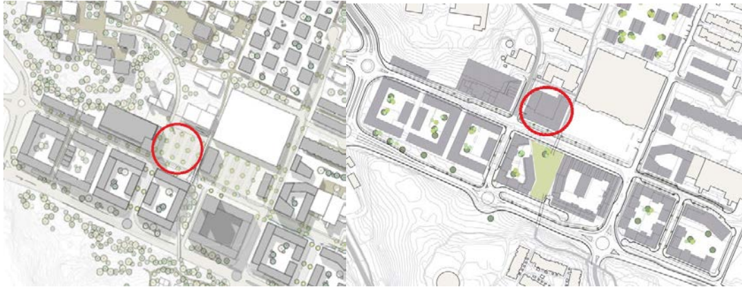
Bilden till vänster visar förslaget enligt detaljplaneprogrammet. Bilden till höger visar stadsbyggnadsprojektets föreslagna placering.