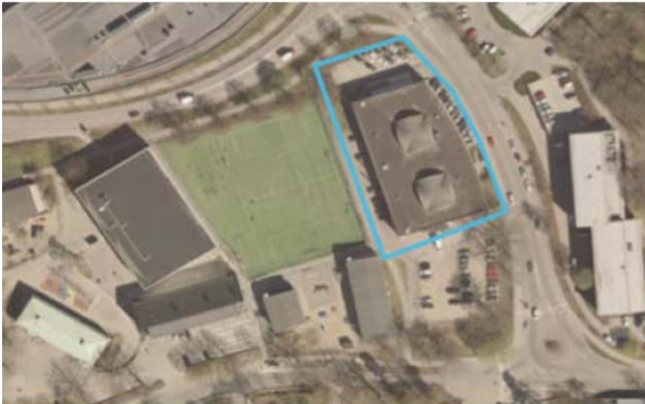
Bild 3, Industrihuset markerat med blå linje

I östra delen av projektområdet vid Planiarondellen finns f.d. Precisionsverktygs industribyggnad, (nedan kallad Industrihuset), som många idag även känner till som Konstnärernas Kollektivverkstad eller förkortat KKV-huset. För att förbereda för nästa steg i projektet har hyresgästerna sagts upp för avflyttning och Industrihuset ska rivas.