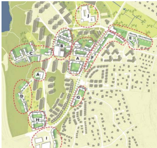
Etapper inom detaljplaneprogrammet för Älta centrum som antogs i kommunfullmäktige 2015

Inom programområdet för Älta centrum (se nedan illustration över programområdet) är behovet av samordning störst. Den största detaljplanen i centrumområdet, etapp A och B, som var ute på samråd under vintern 2017/2018, omfattar närmare 1 000 bostäder.