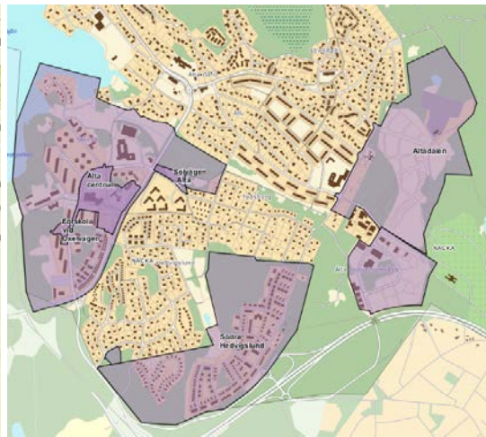
Bilden illustrerar pågående stadsbyggnadsprojekt inom samordningsprojektet. Utöver dessa sker vid behov samordning av andra projekt som planeras inom hela Ältaområdet.