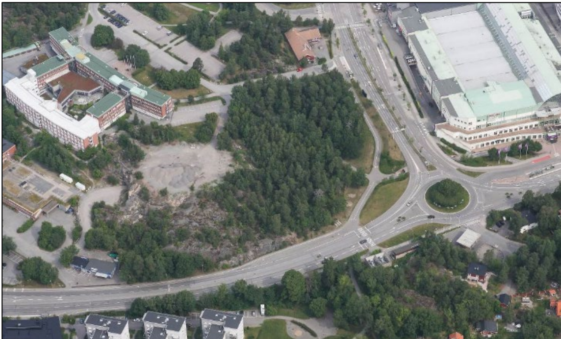
Bild 2, flygfoto över planområdet sett från söder. Stadshuset till vänster i bild och Nacka Forum till höger. Bouleparken längst ner i bilden.

Söder om planområdet och strax söder om Värmdövägen finns en lågpunkt i ett parkområde som har studerats som lämpligt läge för en dagvattendamm för rening och fördröjning. Ytan med befintlig planbestämmelse Park som kommunen äger är tillräckligt stor och i övrigt lämplig för att klara kravet på att inte öka belastningen på recipienten Järlasjön. Anläggandet av dagvattendammen är därmed en viktig del för dagvattenhanteringen inom planområdet och en förutsättning för detaljplanens genomförande.