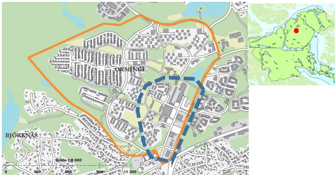
Figur 1 Projektområdets geografiska avgränsning illustreras ovan, orange linje samordningsprojektets utbredning, blå streckad linje planprogramområdets avgränsning. Lilla kartan visar var i Nacka kommun området ligger.

En etappvis utbyggnad planeras av allmänna anläggningar i Orminge centrum. Utbyggnaden planeras genomföras i fem etapper inom centrumområdet under en period av cirka fem år, se figur 2. Etapp 1 (grön) är klar, utbyggnad etapp 2 (gult område) och har beviljad budget. Detaljprojektering av etapp 3 (rött område) pågår.