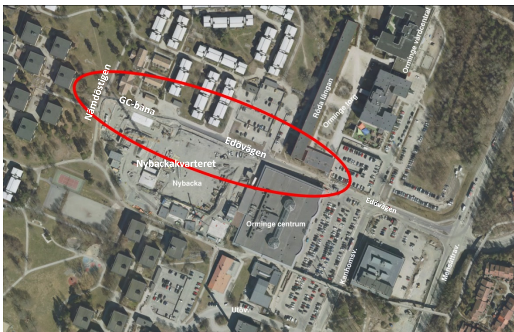
Bildtext: Karta visar ett flygfoto över projektområdet.

Ursprungligen ingick åtgärden som en del i stadsbyggnadsprojekt Nybackakvarteret (se Utbyggnads-PM Nybackakvarteret KFKS 2015/713-251 2018-03-13) men i samband med genomförandeplanering av allmänna anläggningar inom Orminge centrum 2017/2018 beslutades att även denna del skulle ingå i projekt Samordning Orminge centrum som en egen etapp.