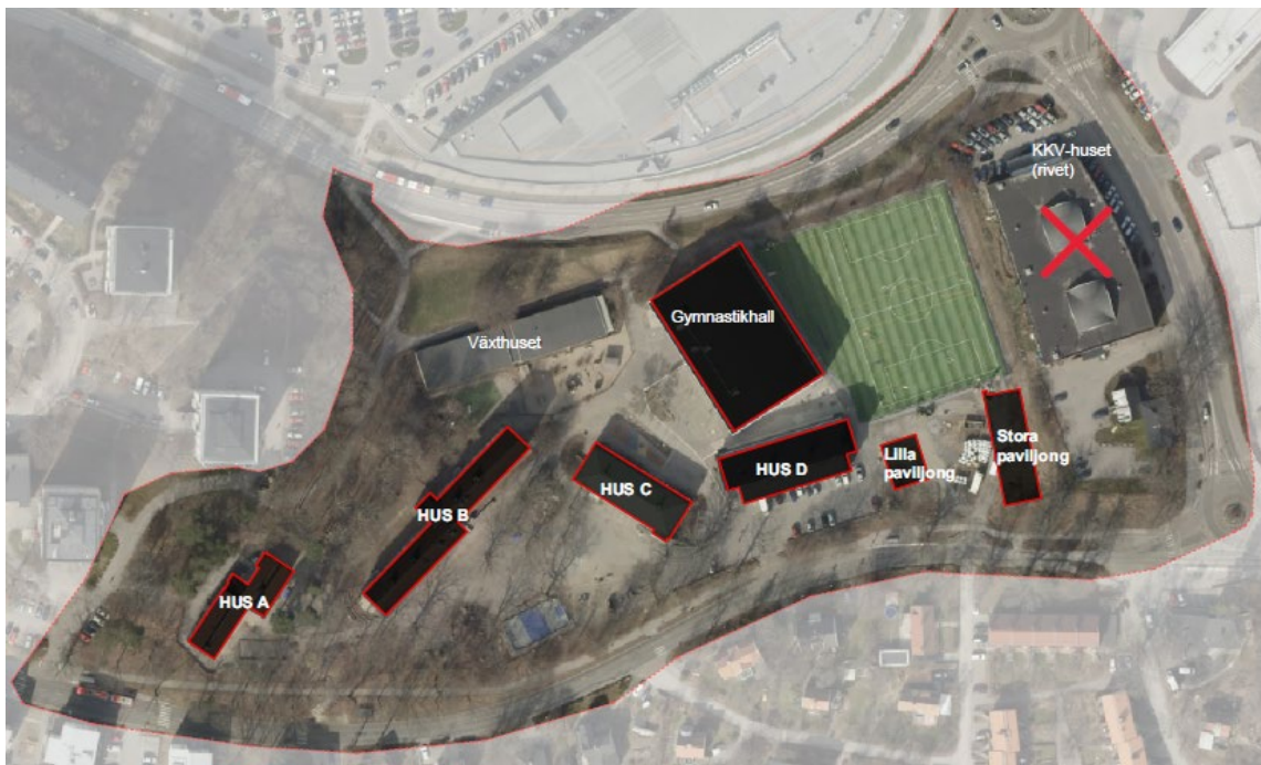
Området projektet omfattar

Skolan och förskolan nyttjar Hus A, B, C, D, Växthuset, gymnastikhallen och sjuspelarfotbollsplanen. Skolan nyttjar även de två paviljongerna som står på tillfälligt bygglov. Sedan KKV-huset rivits består östra delen av området, förutom fotbollsplanen, av en grusad yta och en parkeringsplats. Växthuset, där det bedrivs förskoleverksamhet, är i mycket dåligt skick och i akut behov av att ersättas. Hus A, B och C är byggda på 1950-talet och i behov av upprustning. Sickla skola är utpekad som enskild byggnad av kulturhistoriskt intresse i Nackas kulturmiljöprogram.