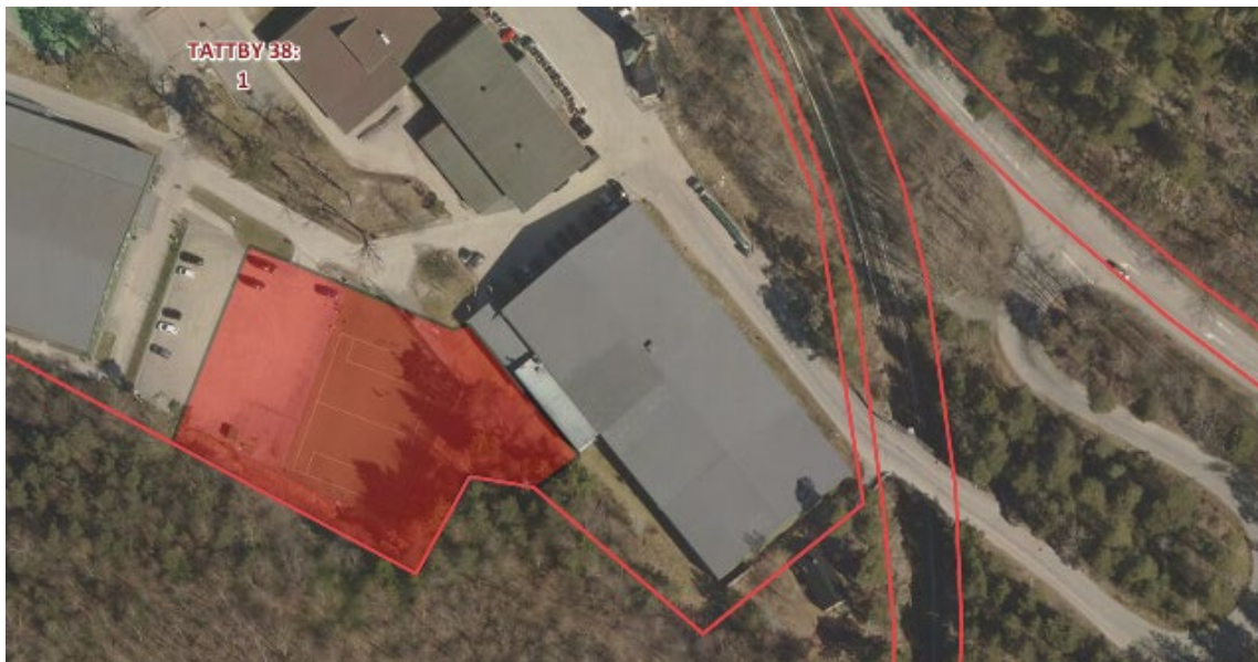
Tillbyggnadsområdet, markerat i rött, ansluter till befintlig tennisanläggning.

Saltsjöbadens Lawntennisklubb arrenderar ett markområde inom kommunens fastigheter Tattby 38:1 och Tattby 2:6 för en tennisanläggning. För att möta en ökad efterfrågan på racketsport har tennisklubben sedan flera år planerat för en tillbyggnad av anläggningen. Tillbyggnaden förutsätter att tennisklubben får tillgång till markområdet, i anslutning till befintligt arrendeområde, som idag utgörs av en fotbollsplan och del av en parkeringsyta. För att möjliggöra en tillbyggnad av tennisanläggningen behöver berörda anläggningar ersättas och detaljplanen för området ändras. Kommunen och tennisklubben har under året förhandlat om förutsättningarna för projektet och är nu överens om projektets former i det till tjänsteskrivelsen bifogade avtalsförslaget, bilaga 1. Avtalsförslaget reglerar ansvar, finansiering och genomförande av detaljplanearbete, tillbyggnad och flytt av befintliga anläggningar.