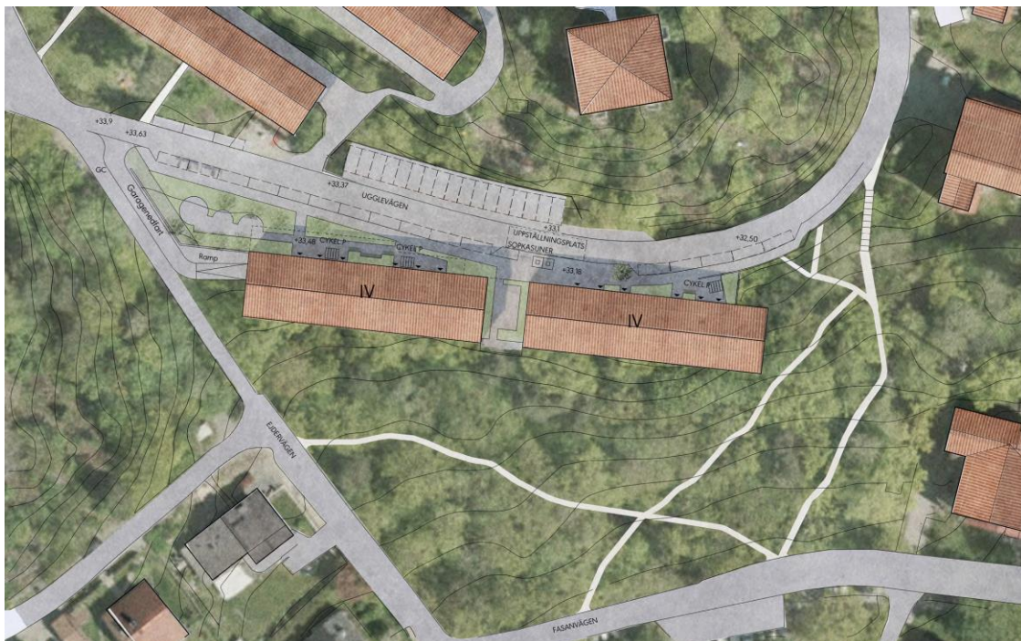
Situationsplan som redovisar den tillkommande bebyggelsen centralt i bilden. Illustration: Bergkrantz arkitektur.

Utformningsbestämmelserna motiveras av att förslaget behöver samspela med den befintliga bebyggelsen inom kulturmiljöområdet för Ektorp-Ugglevägen. Nya byggnaderna ska till såväl volym, gestaltning, fasadmateriell och detaljutförande ta särskild hänsyn till de kulturvärden som finns på platsen och bidra till en god helhetsverkan. Områdets arkitektur är ett fint exempel på arkitektur och planering från 40-talet och är ett uppskattat bostadsområde. Förgårdsmaken – ytan mellan hus och gata - är i förslaget väl tilltaget vilket förstärker det för området karaktäristiska, öppna och terränganpassade gaturummet. De nya husen placeras fritt i förhållande till gatan som en del i kulturmiljöanpassning av förslaget. Hustypen är bekant för området och husen i förslaget förhåller sig i skala, volym och utförande till kulturmiljövärdena på platsen. Gårdsytor tillskapas som en del i förgårdsmarken framför husen. De boende bedöms ha god tillgång till vistelse och rekreation i naturområdet.