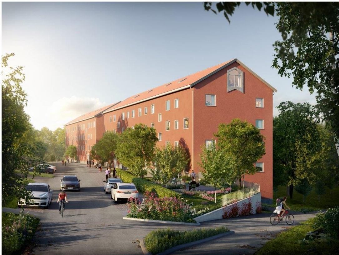
Perspektivbild mot öster som redovisar en möjlig utformning av den nya bebyggelsen och gatan Ugglevägen. Illustration: Bergkrantz arkitektur.

Planområdet ligger i kommundelen Saltängen, cirka 500 meter från Ektorps centrum, och omfattas av ett allmänt naturområde samt delar av gatorna Ugglevägen och Ejdervägen. Detaljplanen möjliggör för två nya flerbostadshus som rymmer cirka 50 nya bostäder.