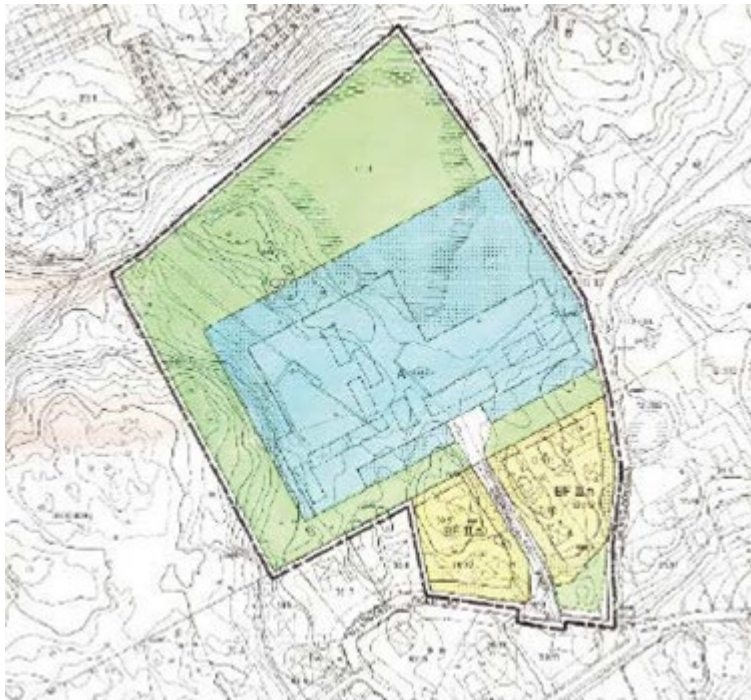
Detaljplan för Borgvallaskolan

Fastigheten (Sicklaön 11:2) har en detaljplan i form av äldre A-plan, denna medger byggnation för skoländamål.