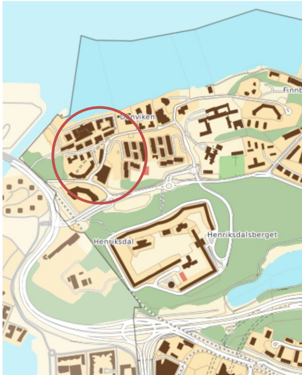
Figur 1; karta där Saltsjöqvarn är inringat