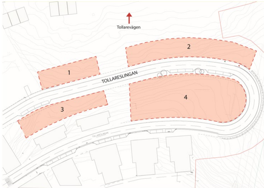
Karta över de olika delområdena kring Tollareslingan.

Inom arbetet för detaljplanerna ska även krav ställas på gestaltning. Användning av färger, material och arkitektoniska detaljer som återfinns på byggnader i Tollareområdet kan vara ett sätt att samspela med omgivningen. Områdets läge i sydslutningen ner mot Lännerstasundet ger goda möjligheter till intressanta utblickar, som ska tillgodoses vid planeringen av bebyggelsen och vistelseytor. Avståndet mellan de nya flerbostadshusen ska även anpassas till områdets karaktär och rytm. Släppen som då skapas mellan byggnaderna kan bevara den kvalitet som finns idag med utblickar och sicklinjer från naturmark, mellan husen och vidare ner mot Lännerstasundet.