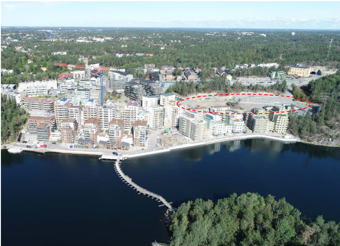
Flygbild över området. Bilden visar flerbostadsbebyggelse i olika utformningar ut mot Lännerstasundet. Till höger syns ytorna för aktuell detaljplan samt kraftledningen.

Befintlig bebyggelse längs med Tollareslingan har en varierad utformning. Väster om projektområdet finns flerbostadshus i tre till åtta våningar, bortom det radhusbebyggelse i tre våningar. Söder om projektområdet finns flerbostadshus i souterräng i tre till sju våningar. Bebyggelsestrukturen är varierad och dess placering i miljön möjliggör för siktlinjer mellan byggnaderna och ut mot vattnet. Norr om området ska radhus byggas längs med Tollarevägen. Öster om Tollareslingan går en kraftledning i nord-sydlig riktning som tangerar projektområdet.