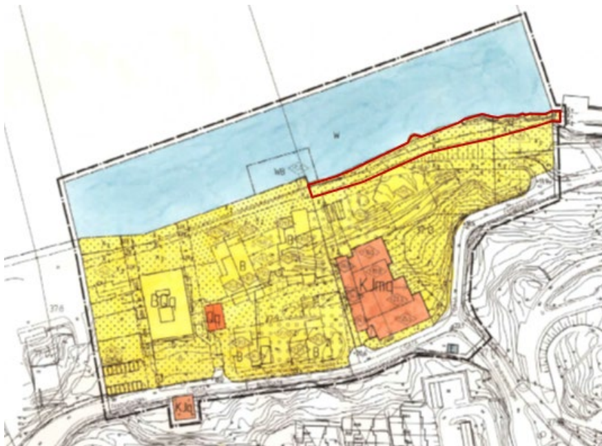
Bild 2: Rödmarkerat område inom fastigheten Sicklaön 37:56 ska utgå från avtalet med samfällighetsföreningen och därmed inte omfattas av framtida detaljplanläggning, anläggningsförrättning och fastighetsreglering.

Mot bakgrund av bostadsrättsföreningens inställning bedömer kommunen att det område inom Sicklaön 37:56 som definieras på bild 3 nedan ska utgå ur det kommande detaljplanearbetet. Konsekvensen blir att området även fortsättningsvis kommer att utgöras av kvartersmark med ett x-område som enligt gällande detaljplan Dp 280 innebär att marken ska vara tillgänglig för allmän gång- och cykeltrafik. Detta har genomförts genom ett avtalsservitut som säkerställer kommunens rätt att nyttja x-området för gång- och cykeltrafik. Det område inom fastigheten som i dagsläget ingår i GA:59 kommer att kvarstå i gemensamhetsanläggningen.