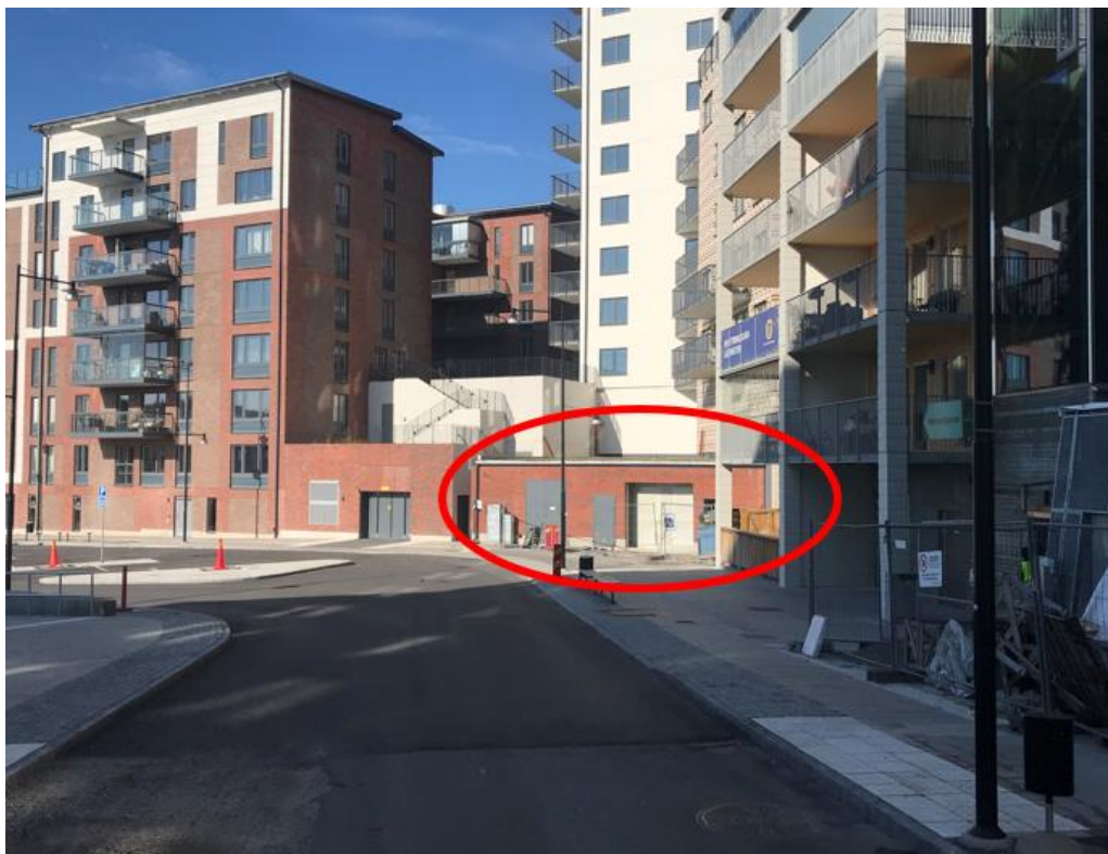
Foto som visar byggnaden inringad med röd färg

Förslag till fastighetsöverlåtelseavtal bifogas denna tjänsteskrivelse, bilaga 1.