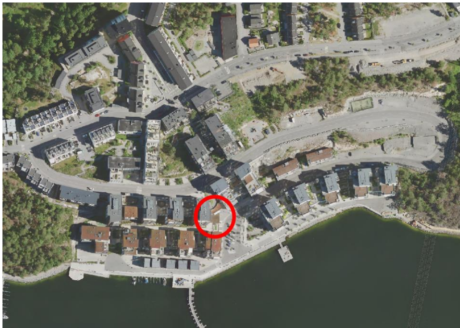
Flygfoto som visar var i Tollare som byggnaden är placerad