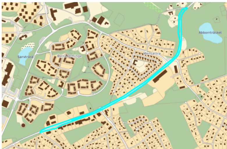
Bo 1:50 och Mensättra 1:13

Trafikverket äger flera fastigheter i längs med Värmdövägen i Nacka kommun, Bo 1:50 (5 797 kvm), Mensättra 1:5 (5 400 kvm), Mensättra 1:13 (19 330 kvm) och Rensättra 1:41 (7 089 kvm). Fastigheterna består till stor del av vägmark. Inom fastigheten Bo 1:50 finns parkeringsplatser som i framtiden kan arrenderas ut eller försälas. Fastigheten Rensättra 1:41 består av natur- och vägmark, inom fastigheten finns också en återvinningscentral som Nacka vatten och avfall AB har ett arrendeavtal för, arrendet löper till 31 december 2028. Arrendet innebär en årlig intäkt på 6 500 kronor. Fastigheterna Mensättra 1:13 och Rensättra 1:41 är planlagda som allmänplats, övriga fastigheter omfattas inte av en detaljplan. Ingen av fastigheterna ligger inom ett stadsbyggnadsprojekt.