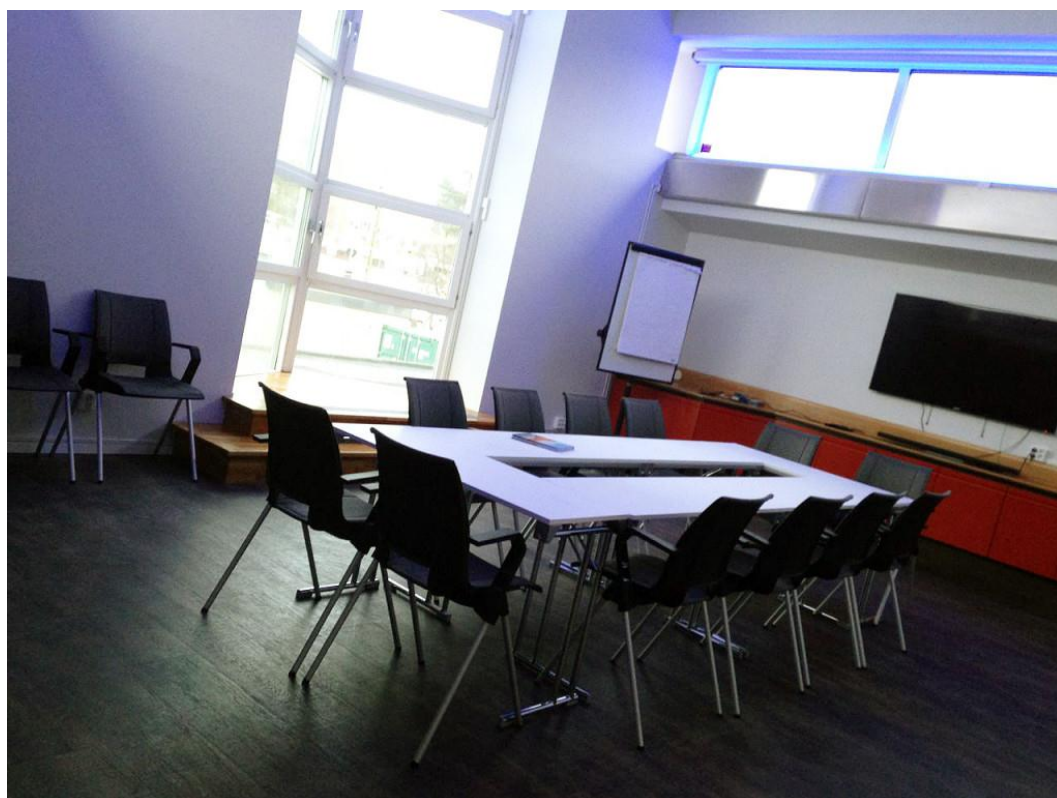
Bild 1. Möjligheter till konferens ryms också i museibygnaden.

En viktig del i projektet har varit samverkan med lokala och regionala aktörer inom utbildning, högskola, kulturarvsektor och besöksnäring, samt näringsliv och ideell sektor. Projektets målgrupper är boende i Fisksätra, arbetslösa, unga vuxna, företagare, utländska och inhemska turister, forskare, skolor, förskolor, boende och verksamma i Stockholmsregionen samt högskolor/universitet i och utanför Sverige.