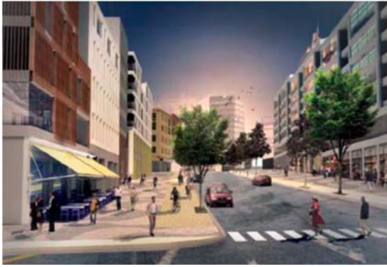
Programillustration för Vikdalsvägen Bild: White arkitekter