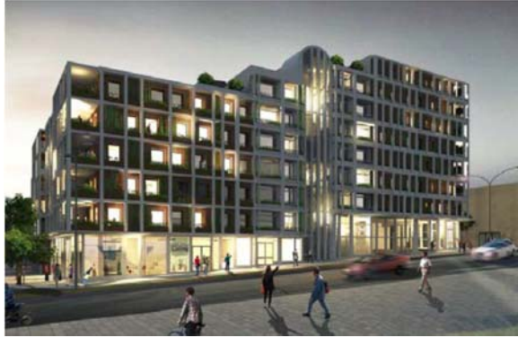
Bostadshus, fasad mot Vikdalsvägen Bild: Kirch och Dereka Arkitekter