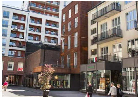
Variation i material och uttryck, Sundbyberg

Tak ska i största möjliga mån kläs i gräs eller på annat sätt kunna bidra till fördröjningen av dagvatten. Tak får också nyttjas som vistelseyta för boende. Terrasser med räcke får anordnas ovan högsta takhöjd.