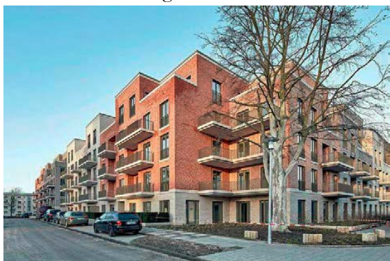
Variation av tegel i Hamburg

Fasadval i de fyra bostadskvarteren bör vara rustika och ha koppling till Sicklas industriarv, så som tegel, natursten och stål, men även bebyggelse i trä uppmuntras. Varje kvarterssida ska upplevas bestå av minst två sammansatta hus som skiljs åt i exempelvis material, färg eller fönstersättning.