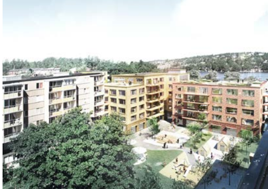
Nummer 1. Förskola och äldreboende i östra kvarteret

Illustrationer av arkitektbyrån Mandaworks: