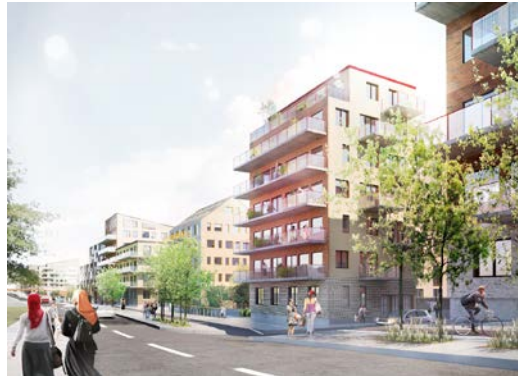
Nummer 2. Fisksätravägen med ny bebyggelse förgrunden