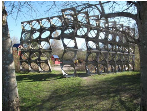
Två delar av konstverket Helheten som är placerade på Båthöjden och Fågelhöjden i Fisksätra.