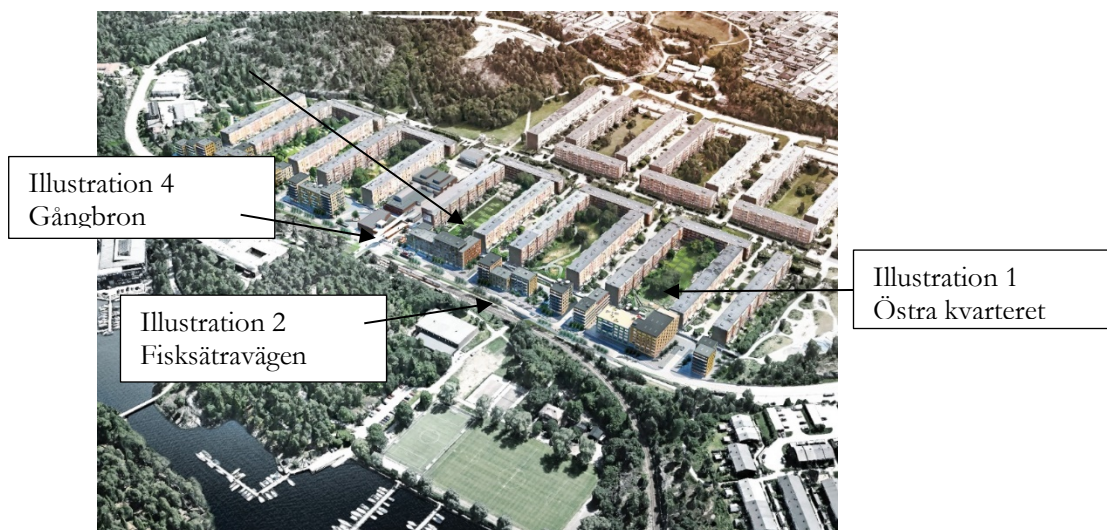
Föreslagen bebyggelse (Bild: Mandaworks)