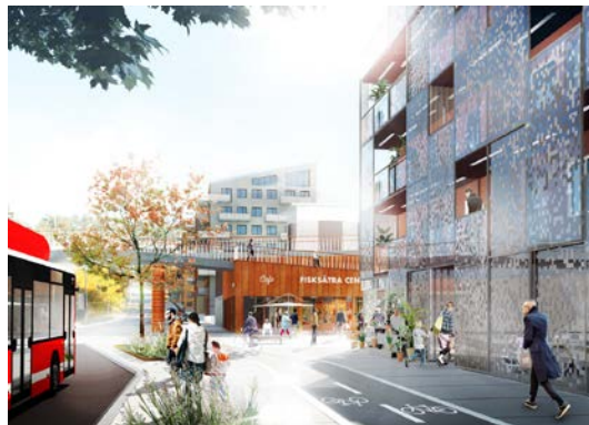
Nummer 4. Gångbron över Fisksätravägen och Fisksätra centrum i förgrunden

Av stor vikt är att de gavelpartier som ligger i förlängningen av de befintliga gavlarna får ett mörkare tegel, medan övriga gavlar kan utföras i tegel i andra kulörer. Centrumkvarteret utgör ett undantag från principen mot bakgrund av att låta byggnaden vara något annorlunda jämfört med de övriga i syfte att markera centrum.