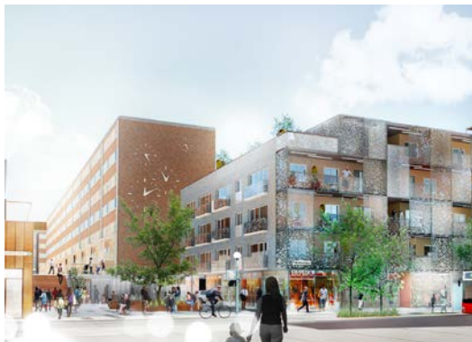
Nummer 3. Det nedre torget vid Fisksätra centrum, Fisksätravägen