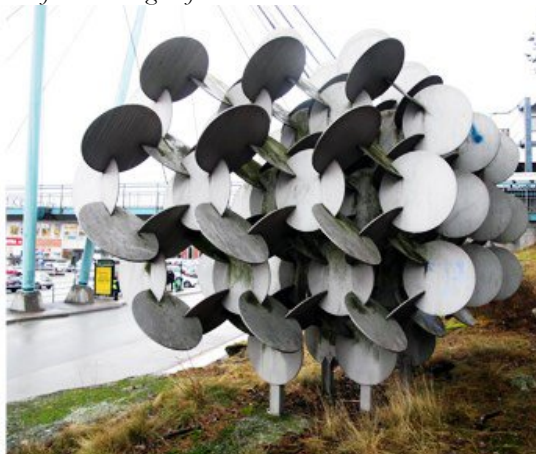
Tredje delen av Helheten är placerat vid Orminge centrum.