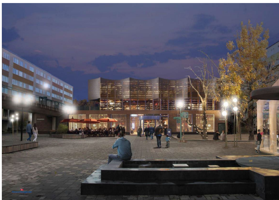
Visionsbild på utformning av Fisksätra Torg och centrumbyggnaden. Utformningen kan komma att ändras. (Bild: SandellSandberg)