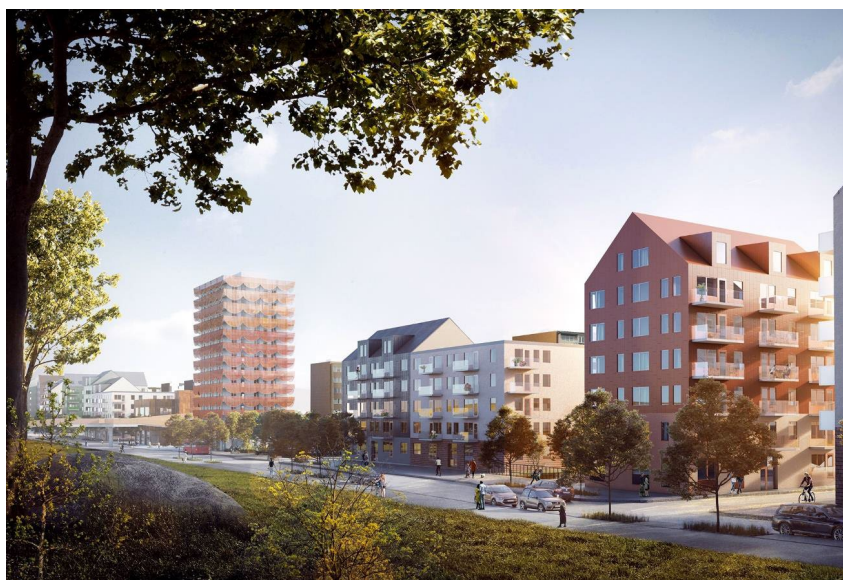
Fisksätravägen med den nya bebyggelsen (kvarter C och kvarter D - punkthuset).