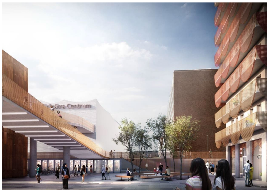
Entréplatsen med den tydliga entrén till Fisksätra centrum.