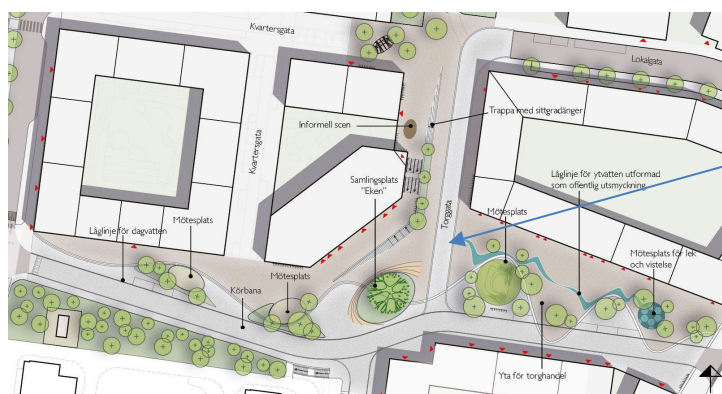
Figur 9. Möjlig utformning av kvarter 2 mot torget, vy från söder. Bild: Semrén & Månsson/Zynka Visual

Planering av ny torggata framför entrén till kulturhuset och över Älta Torg.