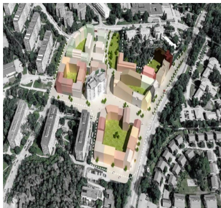
Figur 7. Volymbild, vy från söder. Bilden illustrerar den föreslagna bebyggelsens volymer i förhållande till befintlig bebyggelse (avvikelse kan förekomma).