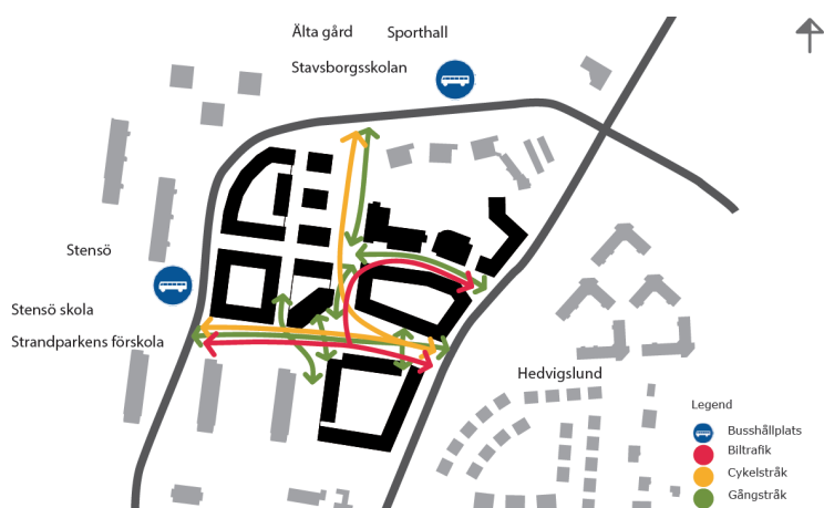
Figur 20. Föreslagna huvudstråk genom Älta centrum för respektive trafikslag.

Utredningar om Ältavägens framtida utformning och funktion pågår tillsammans med vägghållaren Trafikverket. Det föreslagna cykelnätet inom planområdet ger en god tillgänglighet till viktiga målpunkter inom och utanför planområdet (se figur 20) samt till det regionala cykelstråket längsmed Ältavägen. Det föreslagna gångtrafiknätet ger väl tilltagna ytor för vistelse centralt i området. Nätets finmaskighet ger korta gångavstånd och med välutformade gångbanor och passager samt fordonstrafik i gångfart kan gående i alla åldrar röra sig genom området och till viktiga målpunkter på ett säkert sätt. Fler och bättre korsningsmöjligheter för gående och cyklister föreslås över de mer trafikerade vägarna Oxelvägen/Almvägen. Befintlig gångtunnel under Oxelvägen i västra änden av torget kommer att ersättas med ett övergångsställe.