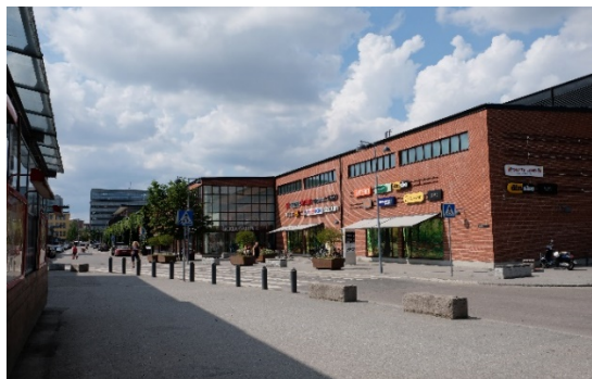
Foto som visar Simbagatan och Sickla, Köp kvarter vy mot väster.