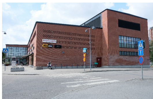
Foto över östra gaveln av Sickla galleria.