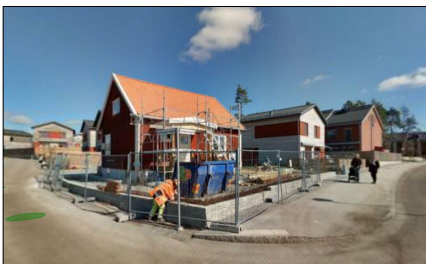
Grindstugan foto 2018-04-28