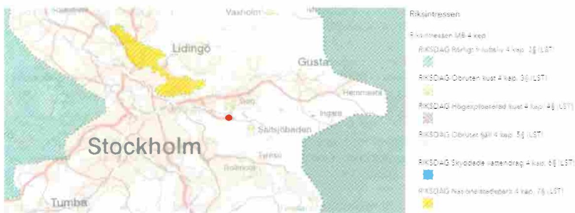
Figur 1: Karta över geografiska riksintressen enligt 4 kap. miljöbalken. Lokaliseringen av den anmälda verksamheten vid Gungviken representeras av en röd cirkel. Notera att riksintresset för rörligt friluftsliv och riksintresset för högexploaterad kust är delvis överlappande. Hämtad 2019-03-22 från https://gis2.boverket.se/apps/js/www/riksintressen/

Söder om Gungviken ligger Nacka-Erstavik-Flatens riksintresse för friluftslivet. Avståndet mellan Gungviken och Nacka-Erstavik-Flatens riksintresse är betydande. Avståndet uppgår till ca 550 till 600 meter. Saltsjöbadsleden, som löper mellan Gungviken och det aktuella riksintresset, kan liknas vid en barriär mellan de båda områdena.