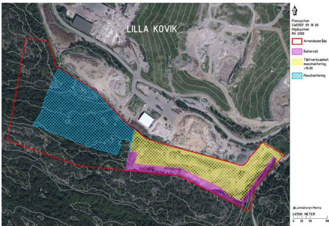
Bild 2. Nuvarande verksamhetsområde.

Bolaget ansöker om ej tidsbegränsat tillstånd för verksamheten, förutom för bergtäkten som begränsas till 20 års drift. Enligt ansökan utökas täktverksamheten stegvis för att, om täktillståndet utnyttjas fullt ut, i steg 3 täcka större delen av arrendeområdet. (Se bild 2 och 3, samt bilaga 4.)