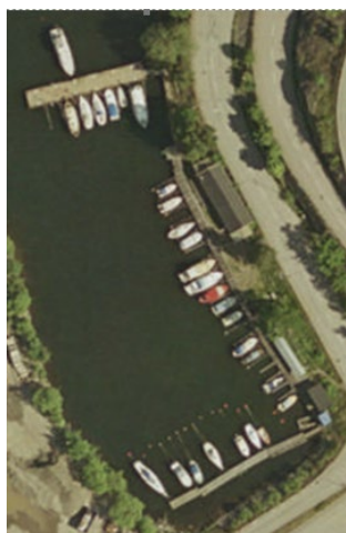
Flygbild från år 2005.

Flygbilderna visar att viken har använts som småbåtshamn sedan mer än tio år tillbaka. Sökande har uppgett och flygbilderna visar att småbåtshamnen har mellan maj 2015 och maj 2016 utökats i storlek och omfattning. Utökningen består av att det har tillkommit två nya bryggor och bryggan som var placerad längst ut i viken har flyttats in och försetts med fler båtplatser än den tidigare hade. Miljö- och stadsbyggnadsnämnden bedömer att dessa åtgärder sammantaget bedöms vara en sådan väsentlig ändring som medför att bygglov krävs. När dessa ändringar gjordes fanns det inte något bygglov. Det är inte tillräckligt att man har ansökt om bygglov utan det krävs att bygglov och startbesked beviljas innan man påbörjar de lovpliktiga åtgärderna. Det är den som bygger som har ansvaret för att lov finns. Detta innebär att det har skett en överträdelse av plan- och bygglagen. Eftersom rättelse inte har gjorts ska en byggsanktionsavgift tas ut.