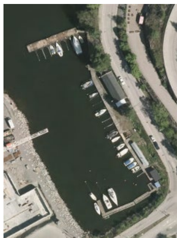
Flygbild från maj 2015.