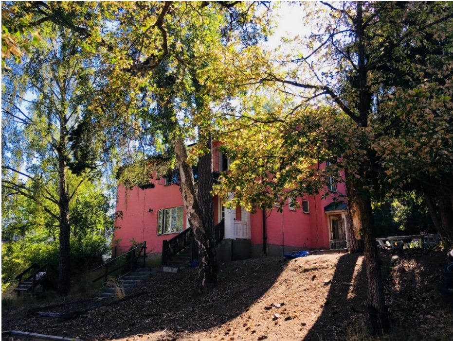
Bild tagen från Duvnäsvägen i juli 2018.