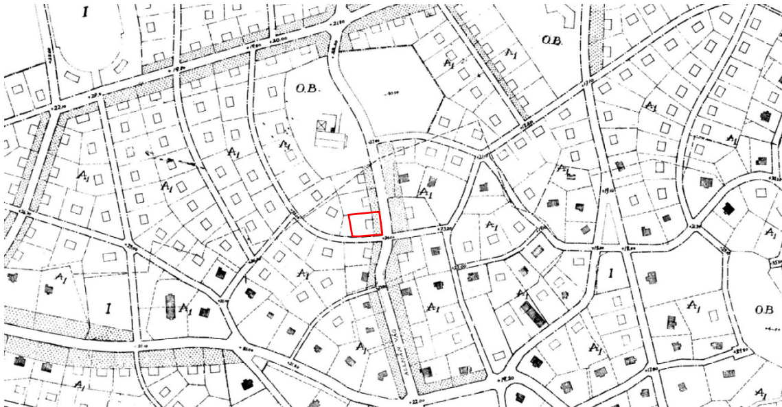
Utsnitt av Byggnadsplan B1 från 1929. Fastigheten Sicklaön 226:13 är markerad i rött.