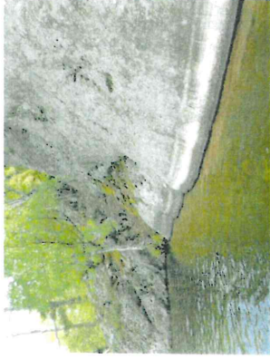
Figur 12. Brant klippfall vid strandkanten som når ned till 3,5 m djup.

I objektet finns klippor på båda sidor om sjön. Objektet har mycket branta strandkanter. Bara en meter från stranden ändras djupet från 1 till 7 meter. Den fotiska zonen når här inte ned till botten och naturtypen bedöms som djup sjö. Naturvärdesobjektet är 3,5 m till 7,8 m djup. Bottensubstratet består av stora klippblock närmast stranden och längre ut i sjön av stora stenar omväxlande med grovdetritus. Värdeelement saknas. Växter som noterades var igelknopp sp., vattenklöver, kräkklöver, topplösa, smalkaveldun, svärdsilja och svalting.