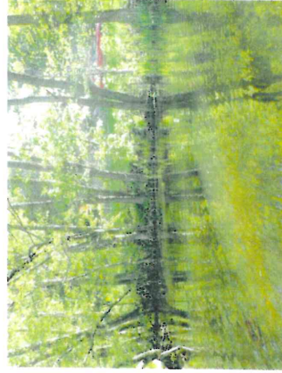
Figur 10. Liten vik av Insjöns sydöstra del.