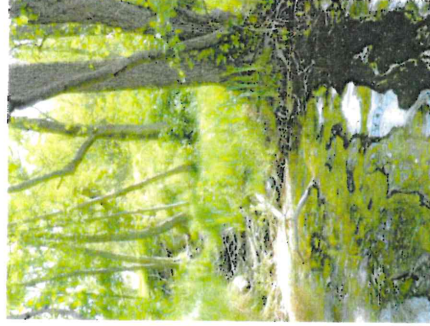
Figur 13. Stora träd väntades nära strandkanten ger upphov till överhäng och död ved.