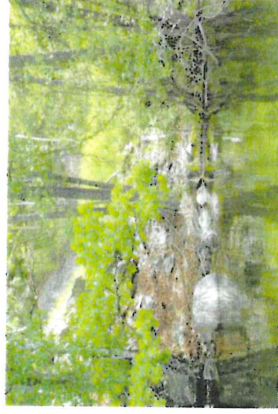
Figur 11. Överhängande träd i strandkant.

I objektet är vattendjupet 1,5 m till 3,5 och den fotiska zonen når ned till botten vilket gör att området bedöms som grund sjö. Bottensubstratet består av stenblock från vägslänten som troligtvis är difflagda i samband med anläggningsarbeten för vägen. Längre ut i sjön finns också stora stenar blandat med grovdeptritus. Enstaka värdeelement finns på strandens västra sida med överhängande träd av klippal och lönn. Markfloran består av gräsarter. Förekomsten av vattenväxter är sparsam med vass, säv, smalkaveldun, svärdslijlja samt finträdiga alger.