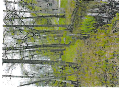
Figur 5. Fuktig skogsmark där diket/bäcken mynnar i insjön.

Delen närmast Lagnövägen ingår i Velamsunds naturreservat och omfattas av strandskydd.