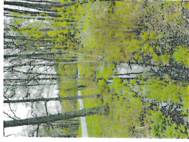
Figur 5. Området genomkorsas av ett dike/bäck.

Området utgörs av ett parti fuktig lövskog mellan Lagnövågen och en grusad gångväg väster därom. Naturvärdesobjektet genomkorsas av ett dike/bäck som dränerar den omliggande skogsmarken. Vattnet är kulverterat i såväl syd- som nordänden av naturvärdesobjektet. Trädskiktet domineras av relativt ung klibbal med inslag av björk och asp. Gamla träd saknas. I buskskiktet växer slån och lövsly. I markfloran återfinns fuktighetskrävande arter som skogssäv, älgört, kabbeleka, kärrsilja, veketåg och flera starrarter. En mindre andel död björkved återfinns i området med bl.a. björkticka, Piptoporus betulinus .