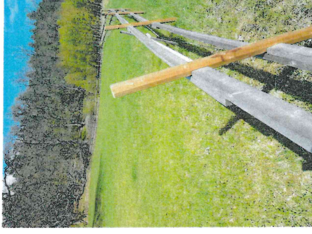
Figur 1. Mörby gamla tomt som ligger centralt i inventeringsområdet. Ett öppet område som idag betas.

inventeringsområdet är långsmalt längs vägen har hela området en karaktär av brynzon med stort ljusinsläpp och påverkan från vägbyggnationen. Skogsmarken är varierad med klubbbestånd, alm-asklund, senvuxen hällmarkstallskog, igenväxande ekhage och barrblandskog. Där Mörby gamla tomt möter Lagnövägen finns rester av det s.k. Snickartorpet. Torpet har anor från 1700-talet och det är troligt att markerna mellan torpet och Insjön i större utsträckning varit öppna. I skogarna runt omkring inventeringsområdet finns gott om nyckelbiotoper och objekt med naturvärden med gamla träd. Även om delar av dessa skogsmarkerna tidigare betats vittnar förekomsten av naturskogliga bestånd om att trädkontinuiteten förmodligen varit relativt lång på många delar.