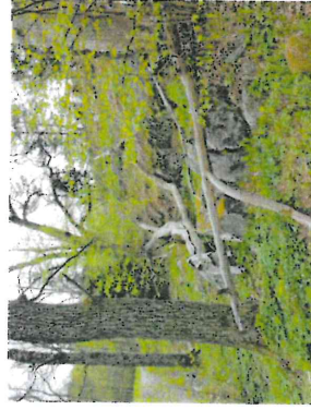
Figur 3. De äldre ekarna har fallit, grova grenar som ligger kvar som död ved.

Naturvärdesobjektet utgörs av en ostvärd sluttning med klippsprång och hållar i dagen som vetter mot en mindre grusad gångväg. Området är bevuxet med ett flertal äldre ekar samt yngre asp. Flera av ekarna är spärregniga, har stamhåligheter, bohål och död ved i kronan samt släppt grova döda grenar på marken. På ek noterades de brunrötande vedsvamparna ekticka, Phellinus robustus (NT) och svavelticka, Laetiporus sulphureus . I buskskiktet växer ung hassel, björk, rönn och gran samt föryngring av tall och ek. Fätskiktet domineras av gräs och örter med arter som vitsippa, liljekonvalj, bergslök, piprör, vispstarr och skogsviol, samt blåbär och örnbräken.