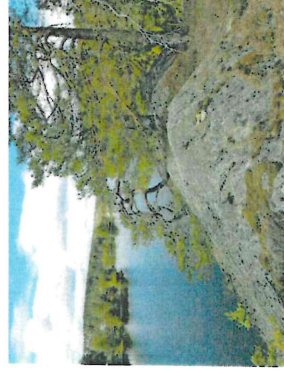
Figur 6. Toppen av bergformationen med utsikt över Insjön.

Hela naturvärdesobjektet ingår i Velamsunds naturreservat och omfattas av strandskydd.