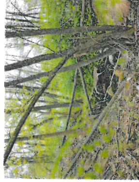
Figur 7. Skogsområdet är påverkat av närheten till vägområdet och dumpning av skrot.

Hela naturvärdesobjektet ingår i Velamsunds naturreservat och omfattas av strandskydd. Gullviva och blåsippra är fridlysta enligt 8 och 9 §§ i artskyddsförordningen. Liljekonvalj är fridlyst enligt 9 § i artskyddsförordningen.