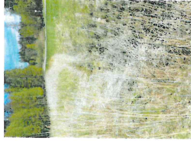
Figur 8. Vattenförande del av dike längs Lagnövågen.

Hela naturvärdesobjektet ingår i Velåmsunds naturreservat och omfattas av strandskydd.