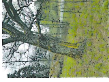
Figur 9. Äldre ek med ett relativt artrikt skorplavsamhälle på barken.