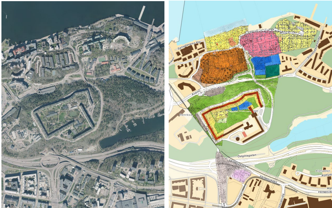
Ortofoto och illustration över gällande planers omfattning och användning.