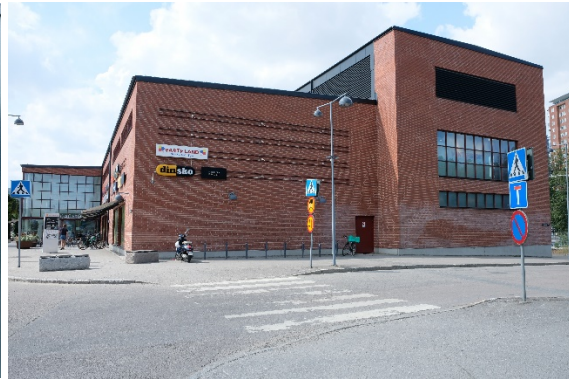
Foto som visar östra gaveln av Sickla galleria.