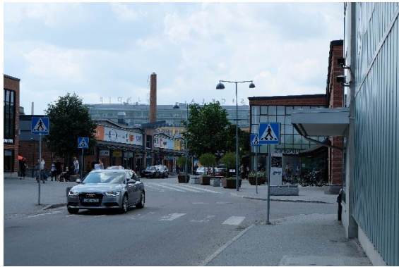
Foto som visar Simbagatan, vy mot väster.