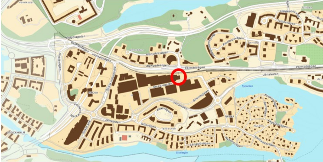
Karta över Sickla köp kvarter med planområdet markerat med röd linje.