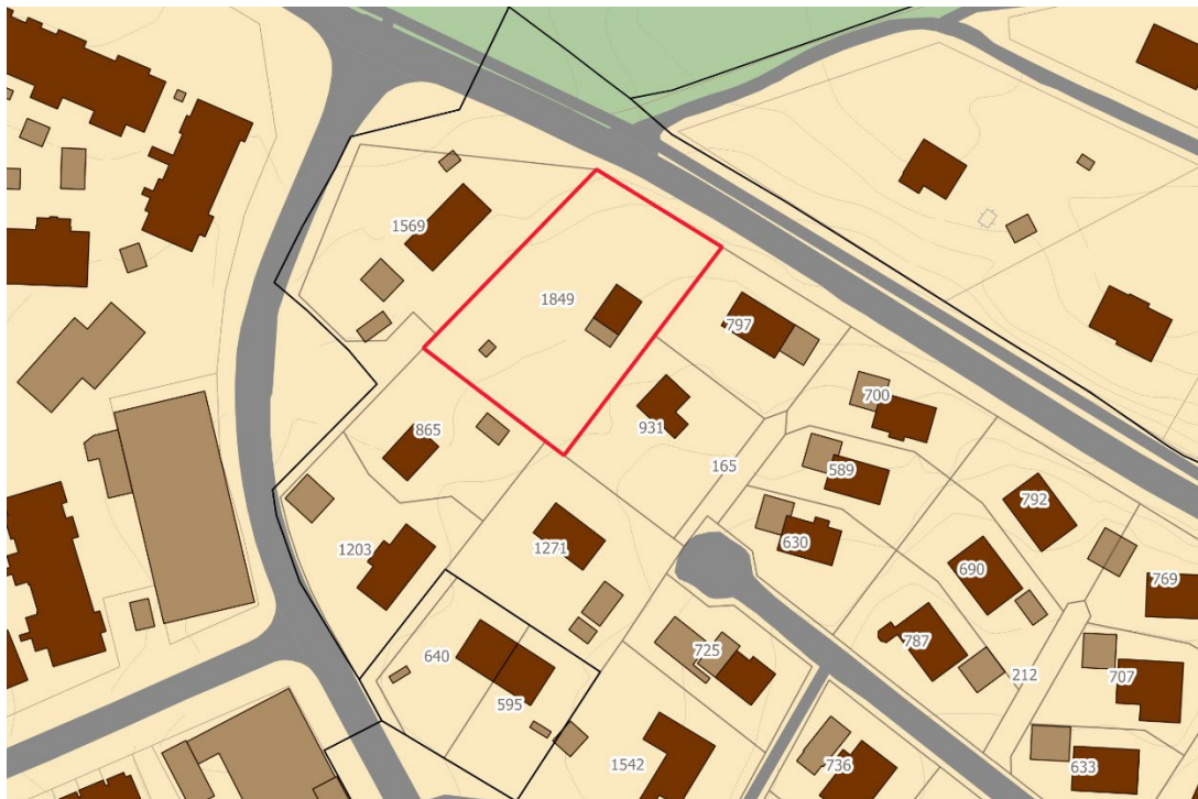
Figure 1. Fastigheters storlek i kvadratmeter i området. Röd markering visar planområdet, Mensättra 19:6.

Fastighetsarean för Mensättra 19:6 är idag 1 849 kvadratmeter. När den delas till två fastigheter blir respektive fastighet mellan 800–1 049 kvadratmeter, vilket är en storlek som är vanligt förekommande inom området. Flera fastigheter i närområdet har mindre area än 800 kvadratmeter. Angränsande fastigheter har en fastighetsstorlek som varierar från cirka 800–1 600 kvadratmeter.