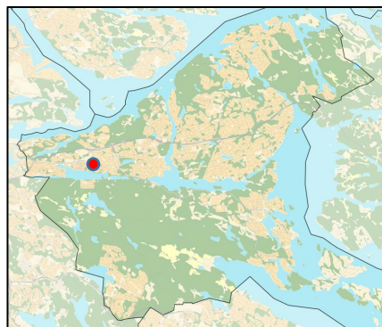
Översikt visar var området ligger