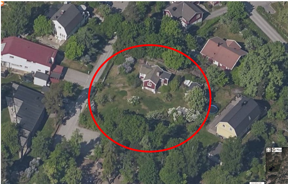
Befintligt fritidshus sett från sydost.

Fastigheten Lännersta 1:166 har en area på cirka 1180 kvadratmeter. Terrängen är relativt plan. Idag är fastigheten bebyggd med ett mindre fritidshus om cirka 55 kvadratmeter. Om fritidshuset kan behållas som komplementbyggnad får avgöras i bygglovsprocessen. Nuvarande fastighetsägare planerar att riva denna byggnad.