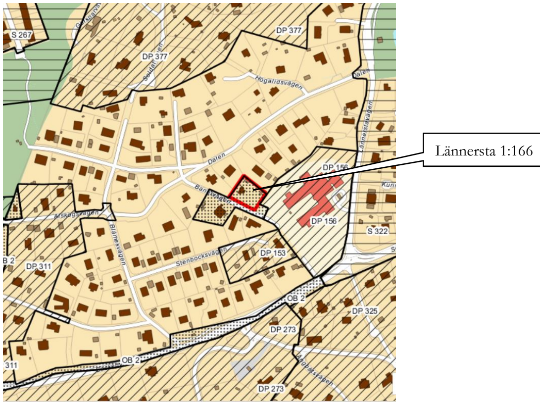
Översikt med gällande detaljplaner samt planlöst område.

För det som kallas ”Dalenområdet” upprättades under början av 1980-talet en så kallad dispensplan. Den innebar ett förslag till lämplig avstyckningsplan - fastighetsplan - för en kontrollerad utveckling av området. Fastigheten Lännersta 1:166 var markerad som en lämplig bostadsfastighet. Större delen av fastigheterna i dispensplanen är idag bebyggda med permanentbostäder. Avstyckningsplanen har ingen formell status idag men ger en indikation på att en utveckling med permanenthus ansågs lämplig. De minsta fastigheterna har en storlek strax under 700 kvadratmeter men flertalet är runt 1000 kvadratmeter stora.