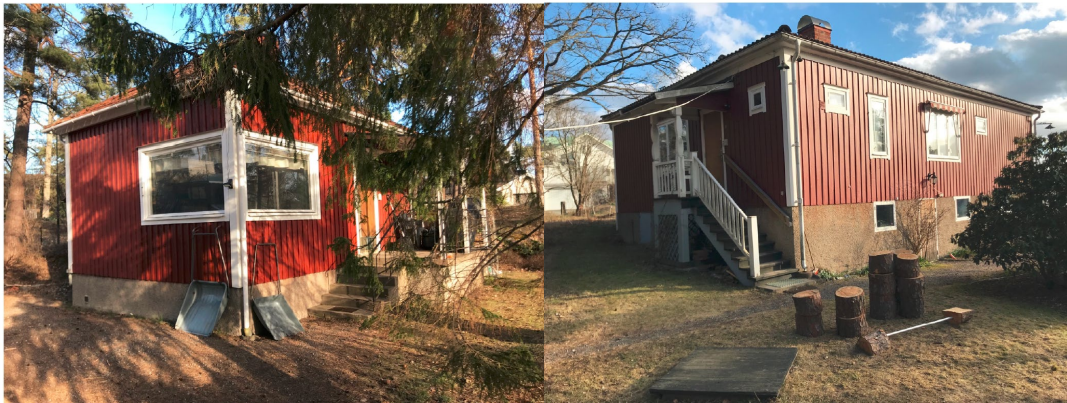
Bilden visar husen på fastigheten Björknäs 10:124, det mindre till vänster och det större till höger.

Vad gäller byggnaderna på fastigheterna Björknäs 10:123 respektive 10:118, ligger delar av byggnaderna på prickmark (mark som inte får bebyggas) men dessa avvikelser är accepterade med dispens respektive mindre avvikelse enligt PBL.