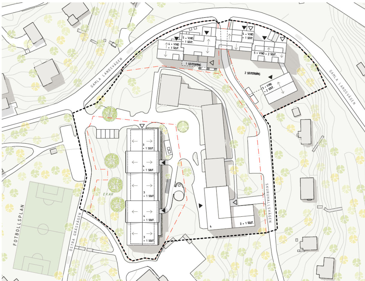
Situationsplan som visar på planförslagets huvuddrag. Planområdet är markerad med svartstreckad gräns. Befintliga byggnader är grå och föreslagna nya byggnader är vita.

Planförslaget föreslår en utbyggnad av cirka 50 nya bostäder inom de privatägda fastigheterna Sicklaön 73:49 och 73:50 samt cirka 70 hyresrätter och 10 gruppboheter på de kommunala fastigheterna Sicklaön 40:14 och 73:119. För en mindre del av det befintliga flerbostadshuset, som byggts till under senare tid, föreslås en utökad bygggrätt. Förslaget möjliggör vidare för en samordning av infart och angöring till det befintliga flerbostadshuset på Sicklaön 73:119 samt till den nya bebyggelsen på Sicklaön 73:49 och 73:49.