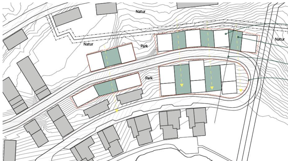
Sökandes förslag, föreslagna flerbostadsbus i vitt, gårdar i blått.