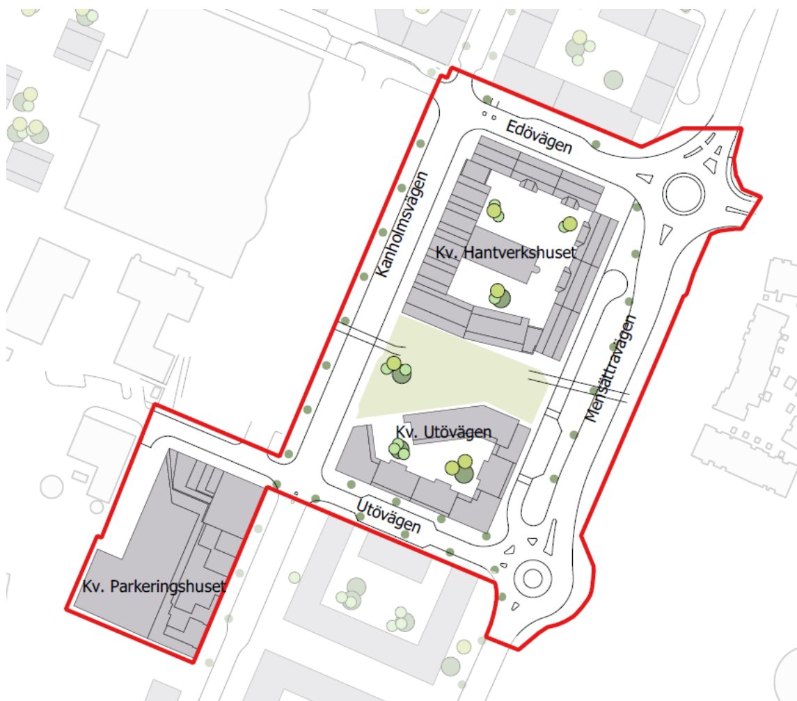
Övergripande situationsplan för planområdet enligt planförslaget, nya byggnader i mörkgrått.

Planförslaget ger förutsättningar för ett befolkat område under olika tider på dygnet, vilket kan bidra till den upplevda tryggheten. Förslag till infartsparkeringar och möjliggörandet av en bussterminal med fler avgångar än i dagsläget skapar incitament till resor med kollektivtrafik. Planförslaget innebär även att Orminge utvecklas med en ny typ av struktur och täthet än den som funnits tidigare i området. Planförslaget kommer innebära en skalförskjutning som frångår Orminges lägre hållna höjder. Större delen av den befintliga naturmarken exploateras och naturytor med påtagligt naturvärde minskar. Den ekologiska spridningskorridoren i öst-västlig riktning försvagas. Detaljplanen omöjliggör inte en eventuell framtida tunnelbaneförlängning i tunnel med stationsuppgångar i Orminge centrum.