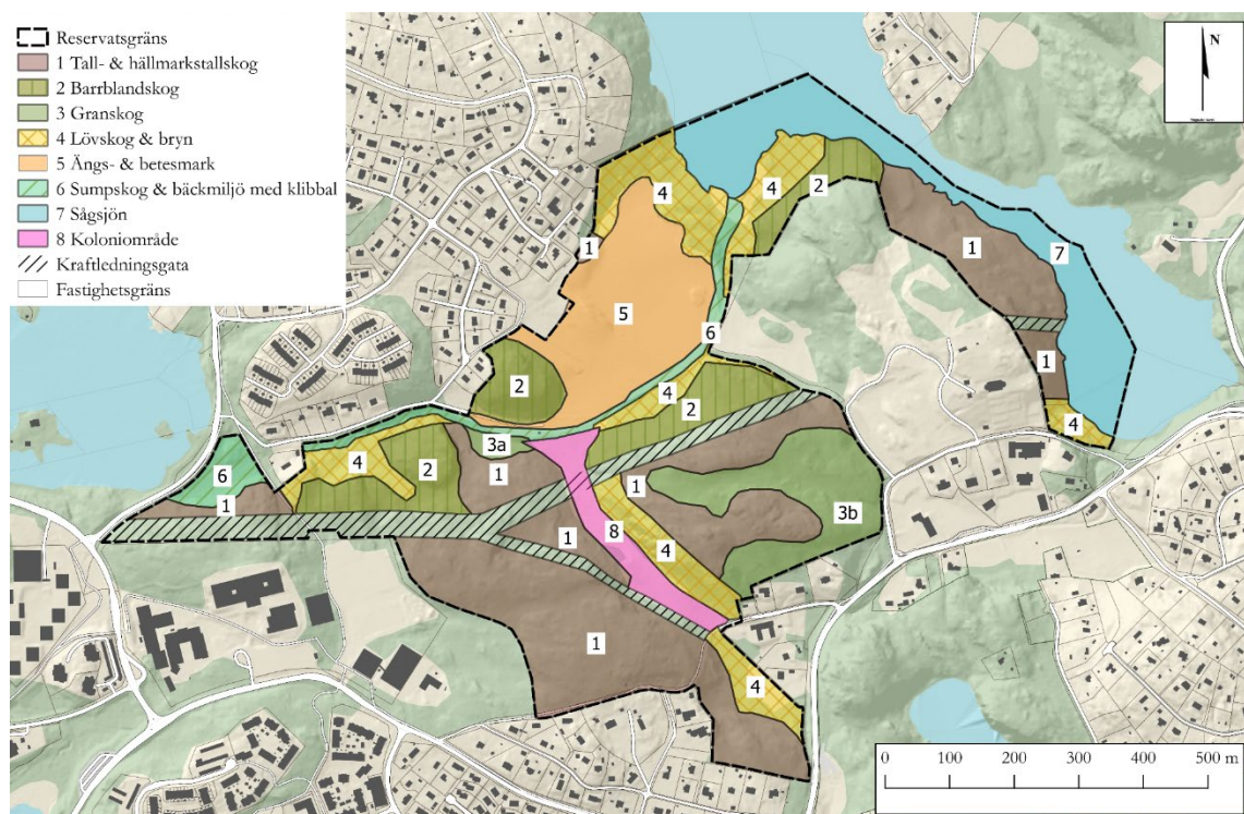
Naturmark inom Rensättra naturreservat

Inom upphävandeområdet finns idag ett stall och ett avtal med Rensättra ryttarförening. Då området består av allmän plats går det inte att teckna nytt arrende med stallet. Men då planen upphävs och reservatet bildas blir det möjligt att teckna ett nytt avtal.